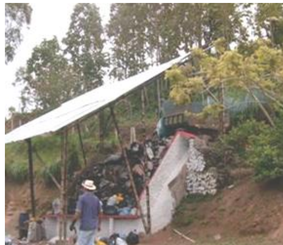
Zona de descarga planta de manejo integral de residuos sólidos . PMIRS- La Victoria