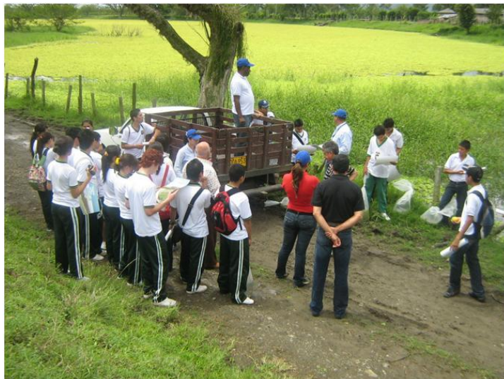
Objeto: Celebración día de los humedales Localización: Corregimiento El Bohío, municipio de Toro Observaciones: Humedal La Pepa visitado por grupo de estudiantes.