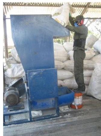
Triturado de residuos en Centro de Acopio