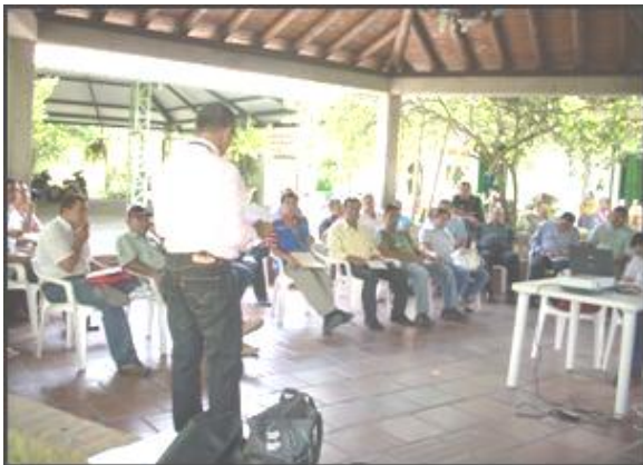
Comité Ambiental Zarzal

Con los Comités Ambientales Municipales se está trabajando el tema del ruido, se apoyaron campañas educativas en Coordinación con la Policía Nacional enfocadas al perifoneo móvil, ventas ambulantes y emisión de ruido en establecimientos públicos.