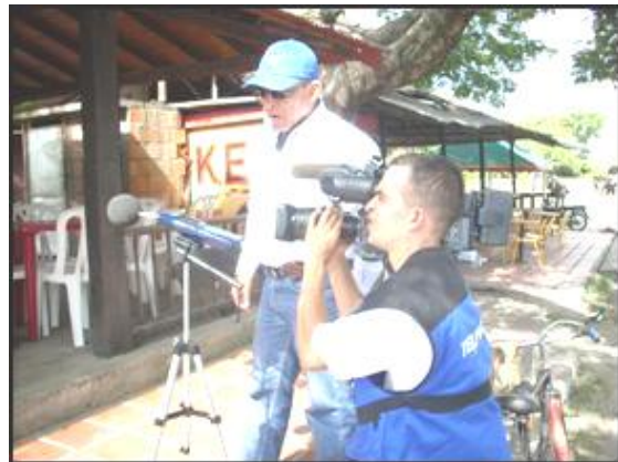
Grabación cuentos verdes Zarzal medición de ruido