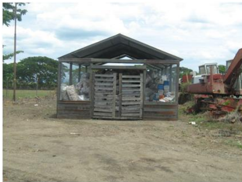
Centro de Acopio residuos sólidos peligrosos

Con respecto al manejo de residuos hospitalarios y estaciones de servicio se contó con el apoyo de un contratista quien realizó visitas a los hospitales y algunas estaciones de servicio de la zona para asesorar a estas empresas en lo relacionado con el manejo y disposición final de los residuos peligrosos.