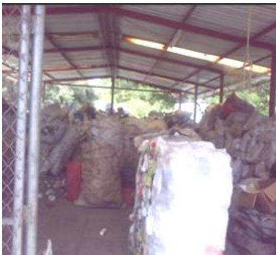
Zona de bodega planta de manejo integral de residuos sólidos . PMIRS- La Victoria

Lo anterior permite que con las acciones adelantadas conjuntamente por los municipios y la CVC en el control y seguimiento de esta situación ambiental se hayan mejorado considerablemente el manejo de los residuos sólidos de estas municipalidades.