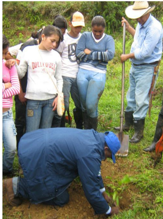
Jornada de siembra de árboles

desarrollo agroindustrial de aproximadamente 10.000 hectáreas de la zona plana del Valle del Cauca.