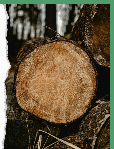
Primerísimo primer plano

Cada uno de los planos anteriores tiene una intención , desde evidenciar el área en general y saber cómo se encuentran los alrededores, hasta identificar el material trabajado y los terminados, como lo indican los planos cerrados.