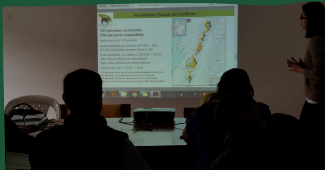
Falta de iluminación

Es necesario hacer un primer recorrido por los espacios y observar a detalle los objetos. Hacer anotaciones para considerar las zonas a fotografiar.