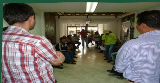
No dice nada