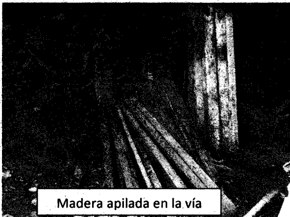
Madera apilada en la vía

Respecto a que se esta aprovechando sobre la zona forestal protectora de la quebrada ballesteros, en el recorrido no se observa dicha aseveración, y el permisionario cumple con las obligaciones de la respectiva resolución.