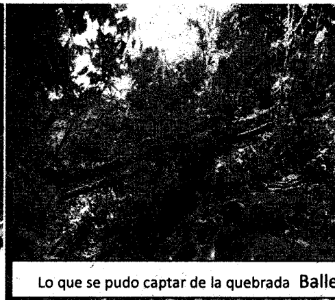
Lo que se pudo captar de la quebrada Ballesterós