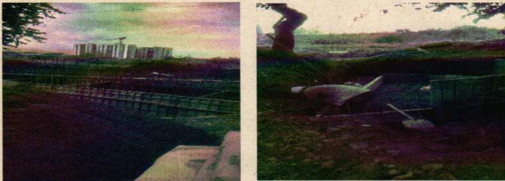
Obra en construcción sobre La Acequia La Esperanza