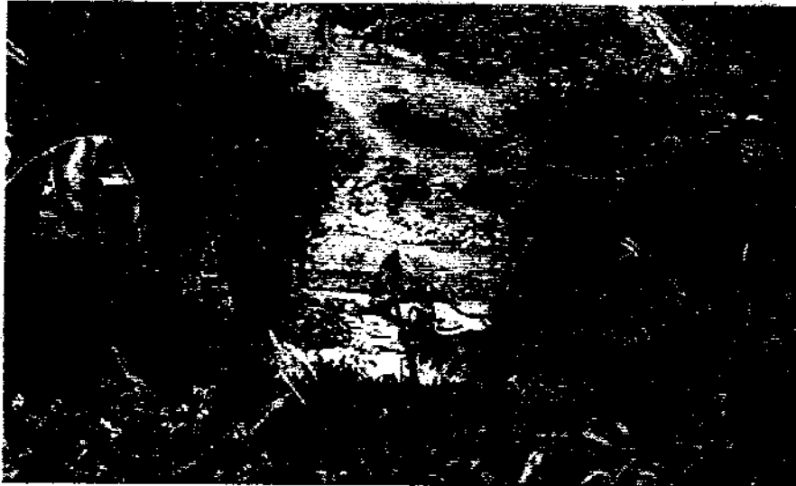
Foto No. 01: Se observa la retroexcavadora en plena actividad construyendo la poceta para proceder a l lavado y extracción de oro en el cauce del río Bugalagrande.

En el recorrido se verificó la explotación de oro mediante la utilización de maquinaria y herramientas como hidrantes, motombas, gradillas y mangueras con el fin de lavar las arenas, ya que se está interviniendo varios macizos rocosos que hacen parte de la llanura aluvial puede poner en riesgo los acueductos antes en mención.