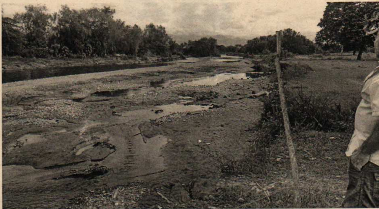
Foto 2: Aspecto del cauce del río Tuluá entre las calles 25 puente de los gatos y la calle 21 o puente de las brujas.