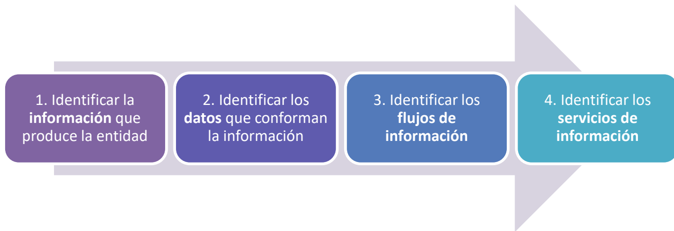
Imagen 2. Actividades para construir el catálogo de componentes de información.

Con el fin de estructurar y documentar los componentes de información de la institución, a continuación se plantean de manera metodológica las siguientes actividades: