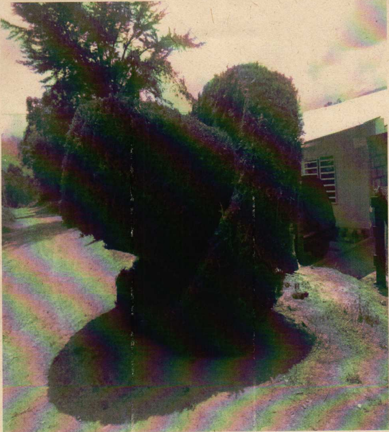
- Foto No.3, imagen del árbol de la especie Ciprés, después de su erradicación.