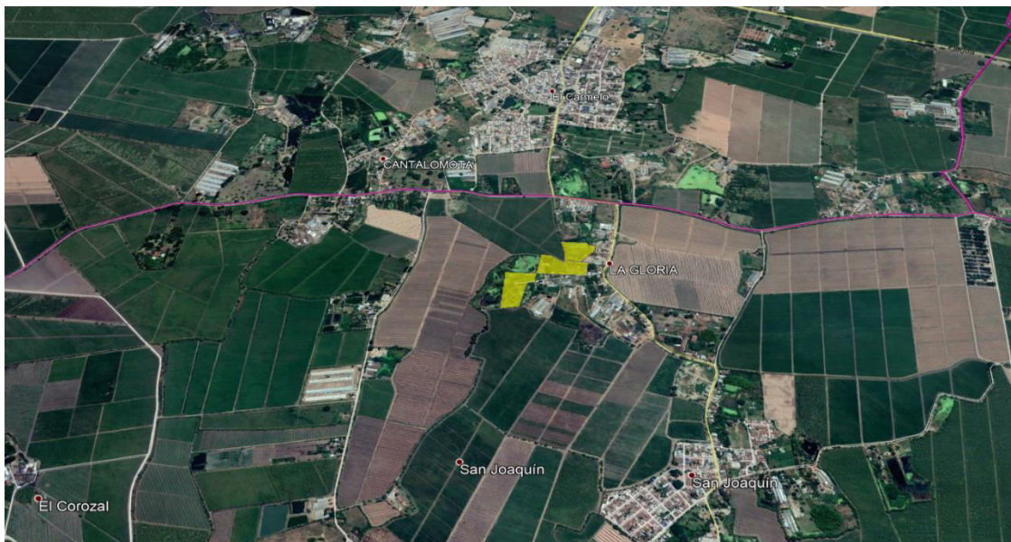
FIGURA 2. LOCALIZACIÓN PREDIO LA CARMELITA – IMG. SATELITAL (GOOGLE EARTH), EN AMARILLO PUEDE APRECIARSE EL PREDIO LA CARMELITA Y LA LÍNEA DE COLOR VIOLETA CORRESPONDE A LA LÍNEA LIMITE ENTRE LOS CORREGIMIENTOS DE EL CARMELO Y SAN JOAQUÍN.