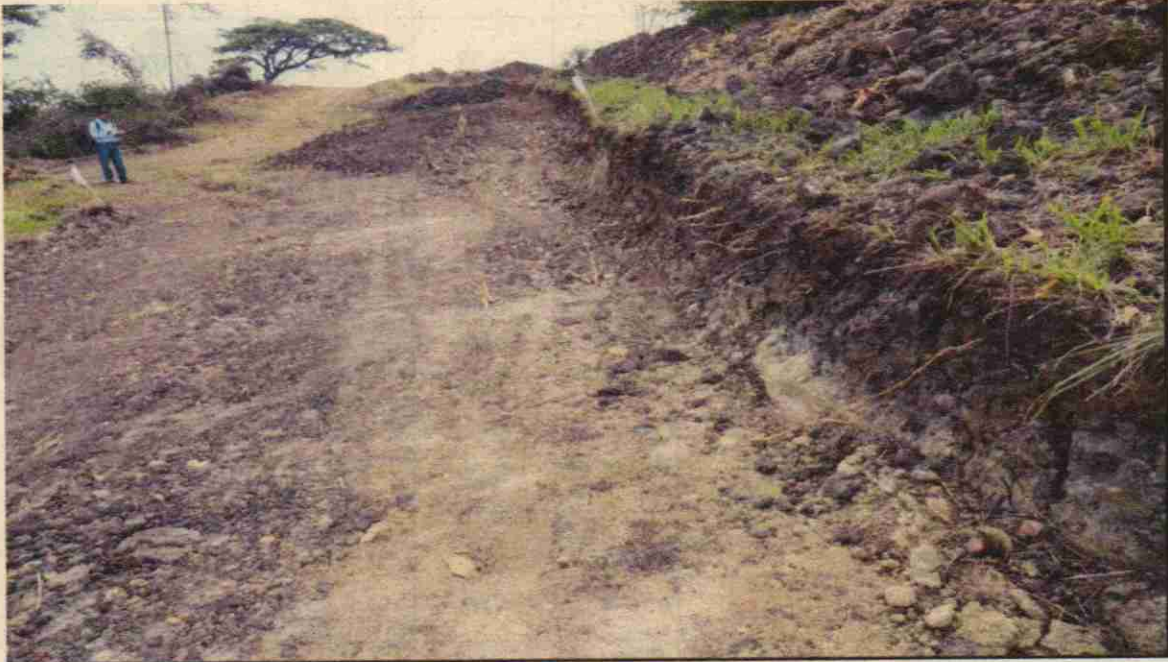
ARBOLES TALADOS EN EL SUELO.