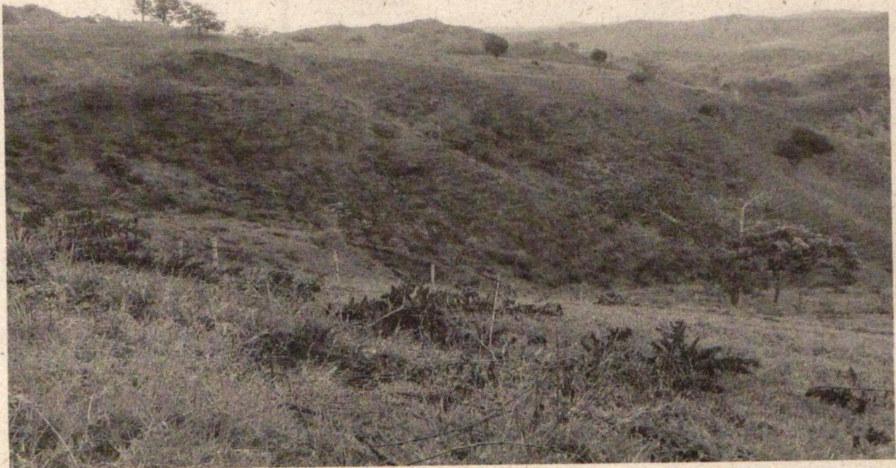
Fotos. 1y2. Aspecto general de los potreros que están limpiando, corte de rastrojos bajos y árboles de guayabo.