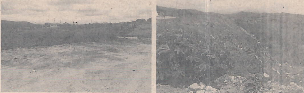
Fotografías. Disposición de tierra en drenaje seco.

RESOLUCIÓN 0760 No. 0761 01106 DE 2019 "POR LA CUAL SE IMPONE UNA MEDIDA PREVENTIVA DE SUSPENSIÓN DE ACTIVIDADES Y SE TOMAN OTRAS DETERMINACIONES"