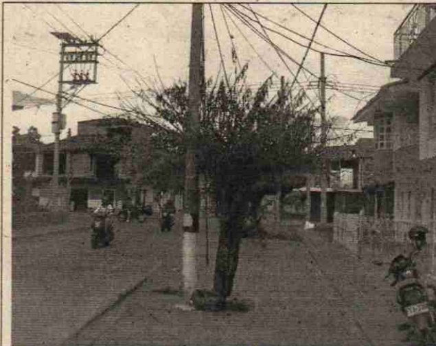
Foto 1. Arbusto de la especie Ébano afectado por quema 23/12/2019.

Realizar visita de seguimiento y control a actividades antrópicas sin acto administrativo precedente. Atención a denuncia anónima por quema de árbol, localizado en la Calle 24 No. 13 – 21, de dicha quema indica al señor Alexander Castañeda. Radicado 937272019.