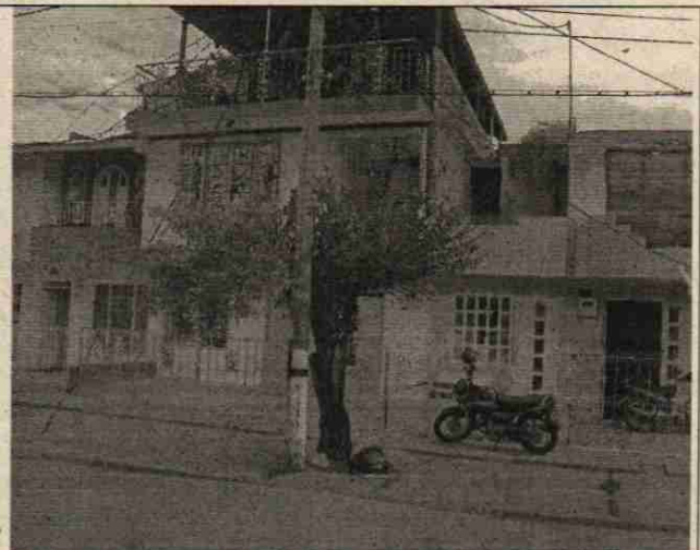
Foto 2. Vivienda frente a la cual se encuentra localizado el arbusto de la especie Ébano afectado por quema, Foto Edilberto Delgado 23/12/2019.