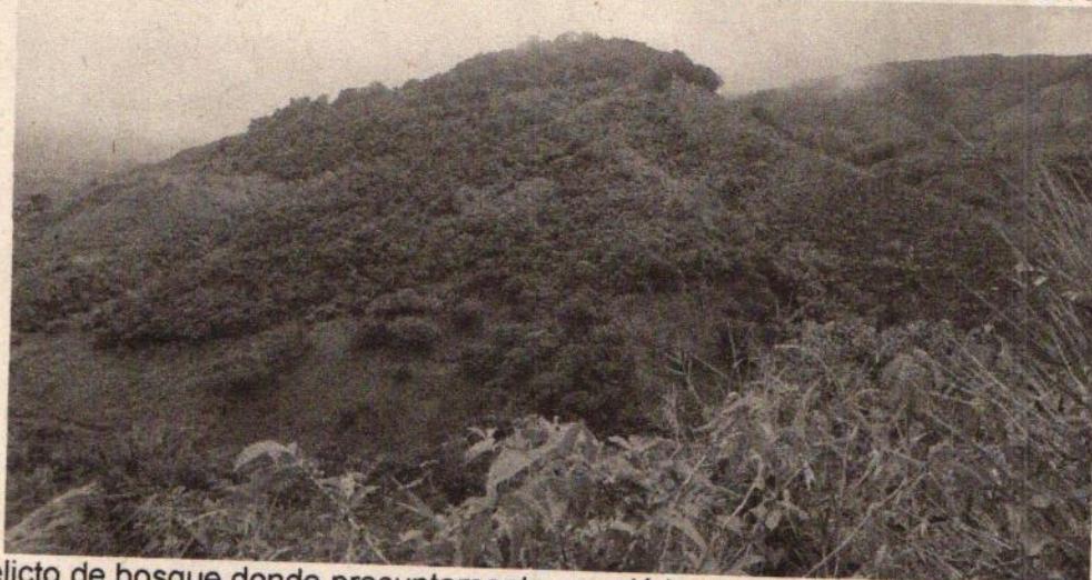
Foto 1. Relicto de bosque donde presuntamente ocurrió la afectación motivo de la denuncia.

Durante la visita no se pudo verificar ninguna afectación a los recursos naturales, ya que el predio propiedad del señor JHON JAIRO RESTREPO, presunto afectante, forma parte del relicto de bosque mencionado y colinda con otros predios de los cuales se requiere conocer parte de los linderos para ubicar el sitio afectado y definir el presunto responsable de la infracción denunciada.