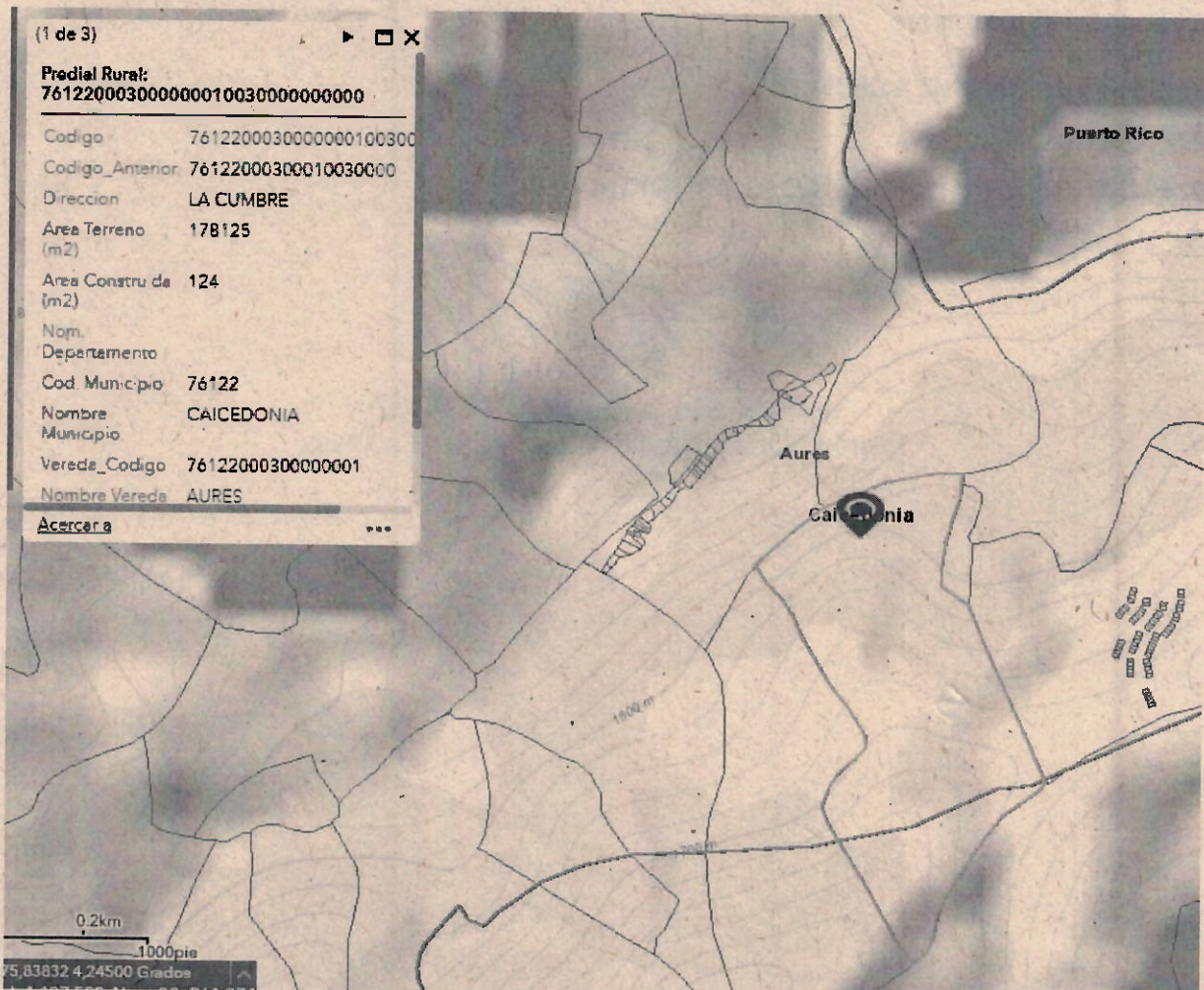
Imagen 1. VISRO GEO CVC AVANZADO, predio La Cumbre, vereda Aures, jurisdicción del municipio de Caicedonia, Valle.

Predio La Cumbre, vereda Aures, jurisdicción del municipio de Caicedonia, Valle del Cauca, coordenadas geográficas WGS 1984, 04°14'16.71"N, -75°50'1.86"W.