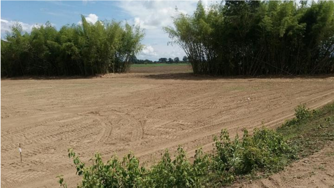
Imagen 4: Jarillón al fondo y parte de la adecuación del terreno.