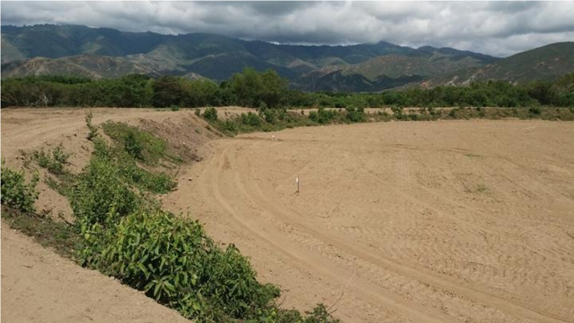
Imagen 1 y 2: realce del Jarillón y parte de la adecuación del terreno.