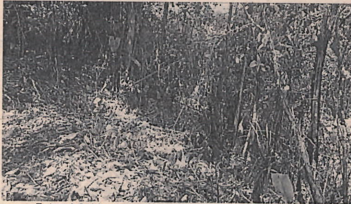
Fotos 1-2. Limpieza de vegetación o socola de bosque.