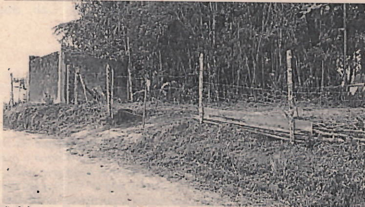
Fotos 3-4. Adecuación de entrada al predio con erradicación de vegetación existente