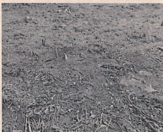
Figura 2. Siembra de matas de maíz, frijol y plátano