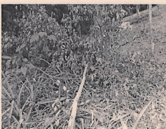
Imagen 3 y 4 se evidencia los árboles talados de arrayan mamey y jigua