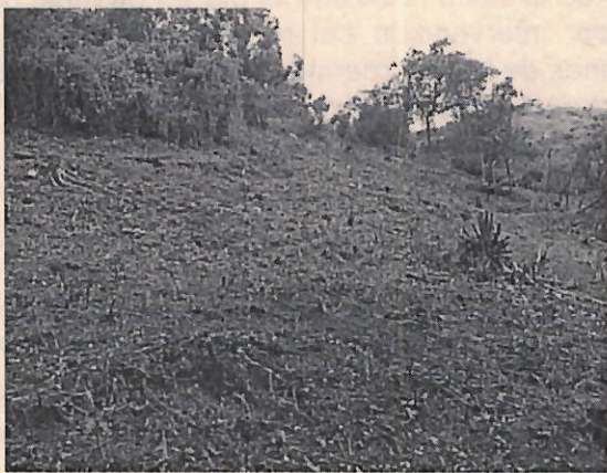
Figura 1. Vista dentro de la zona intervenida.