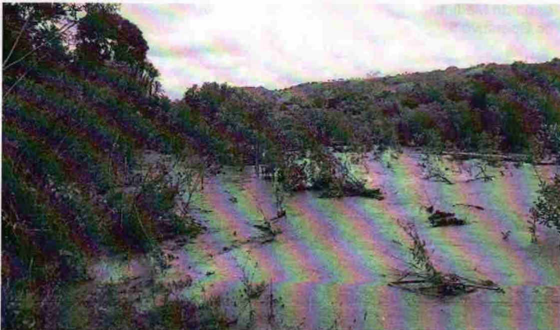
Foto No. 5. Aquí se aprecia que el río en una creciente sí afectó alguna vegetación de la zona protectora.