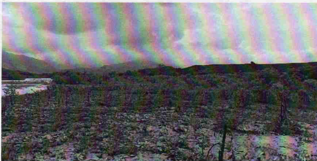
Foto No.1. Aquí se aprecia la margen izquierda del río, sin ninguna intervención.

Se realizó la visita al sitio indicado por el denunciante, se hizo el recorrido a pie por la margen izquierda del río Bugalagrande y observando la margen derecha, 3 kilómetros y mas arriba donde no se evidenció ninguna actividad minera ni afectación de ningún tipo de vegetación arbórea por el área, además el río Bugalagrande por estos días ha aumentado su caudal lo que no permite la presencia de maquinaria sobre el lecho del río.