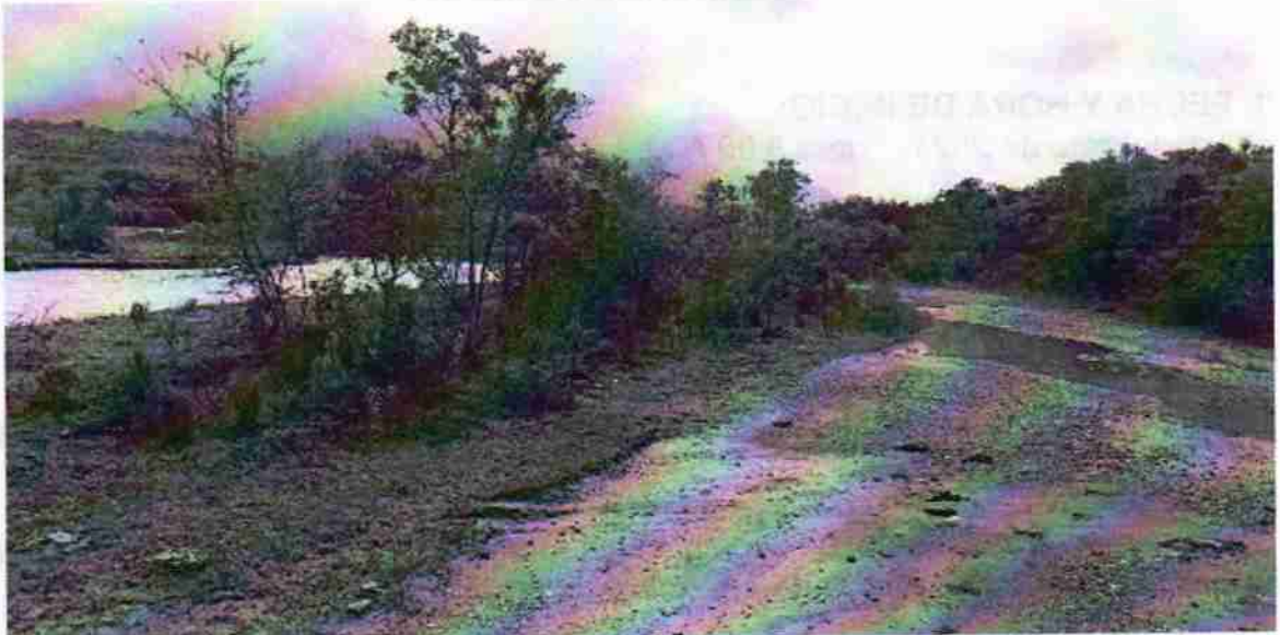
Foto No. 2. Margen izquierda del río y la vía carreteable sin intervención.

Corporación Autónoma Regional del Valle del Cauca