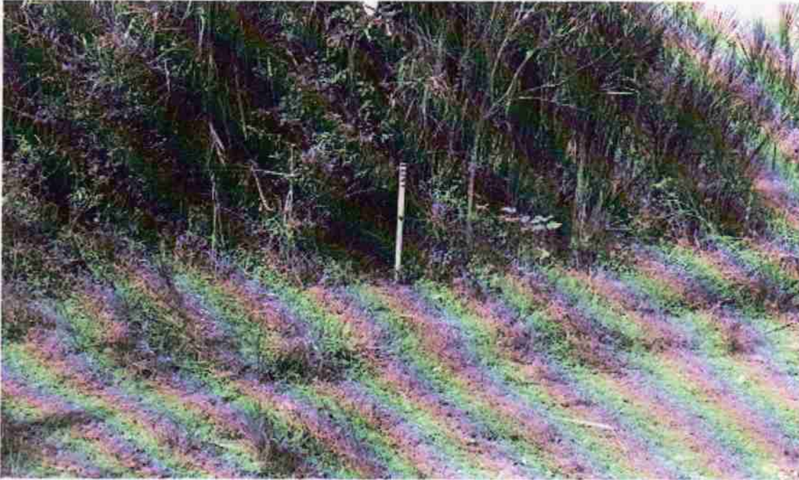
Foto No. 4. Aquí se aprecia la demarcación de algunos polígonos.