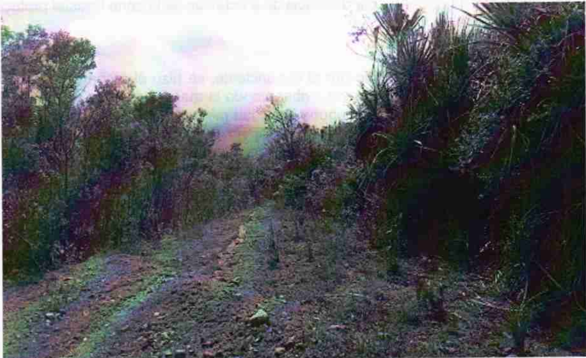
Foto No. 3. Zona forestal protectora del río Bugalagrande.