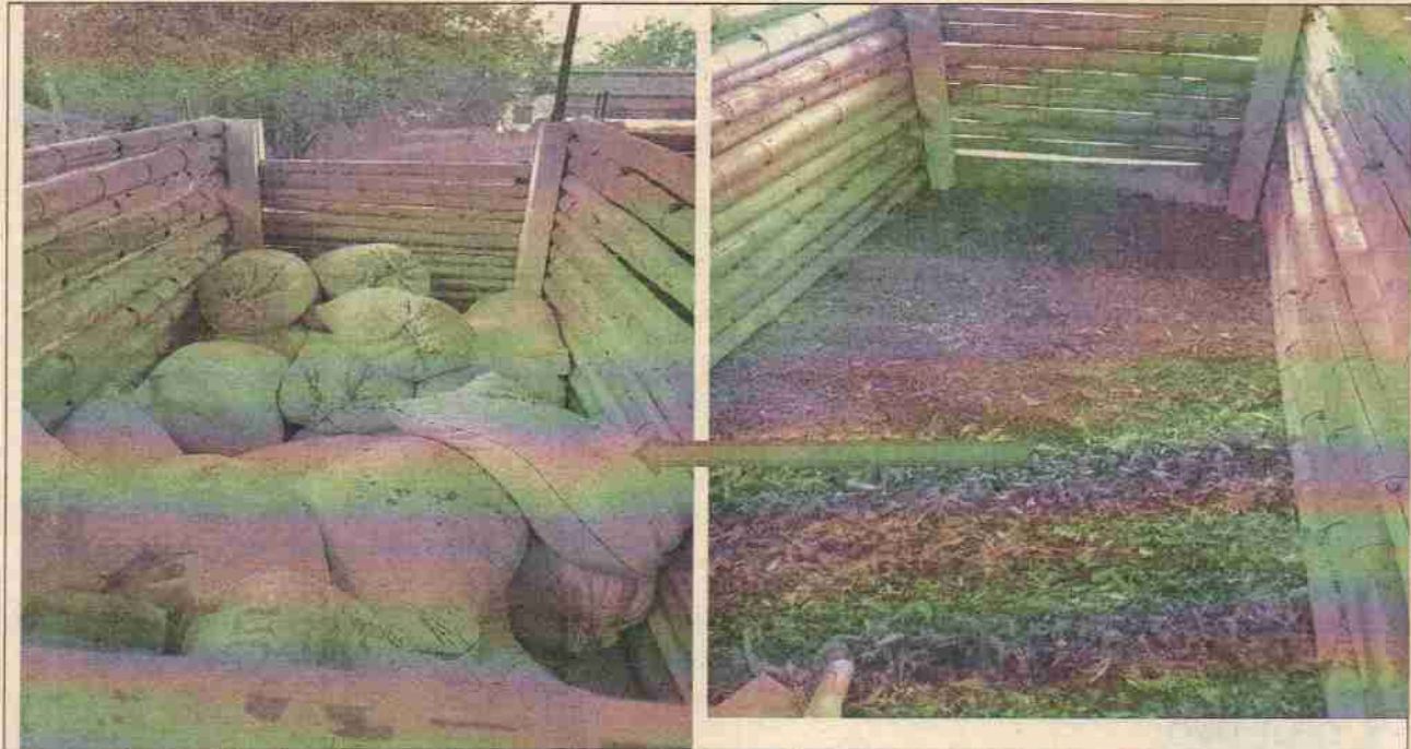
Fotos 1 y 2 sitio donde se almacena la materia orgánica para el compostaje.