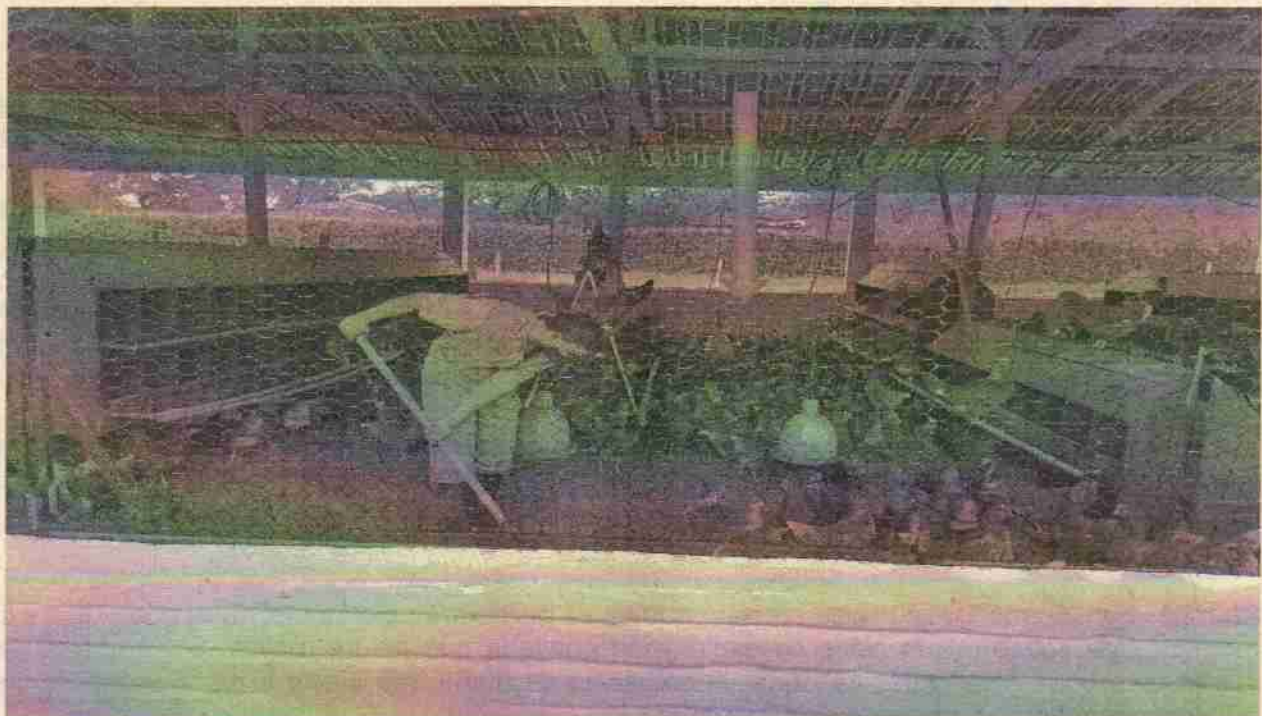
Foto 3, Se realiza el volteo de la cama y residuos de comida producto de la explotación.