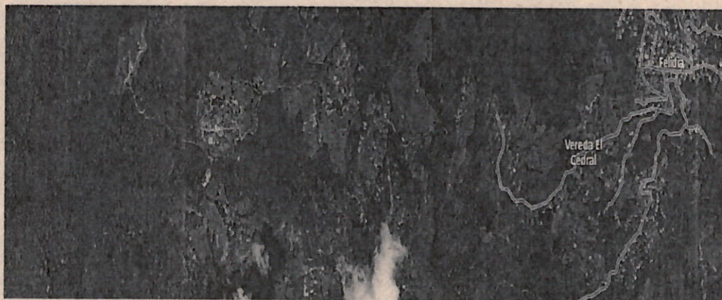
Foto 1. Ubicación geográfica del recorrido realizado.

Jurisdicción del Municipio de Cali, Corregimiento de Felidia - Veredas El Diamante y El Cedral