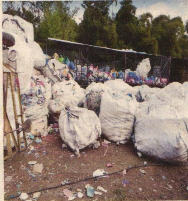
Foto. Depósito de bolsas tipo costal, que contienen envases plásticos que se encuentran dispuestos a cielo abierto.