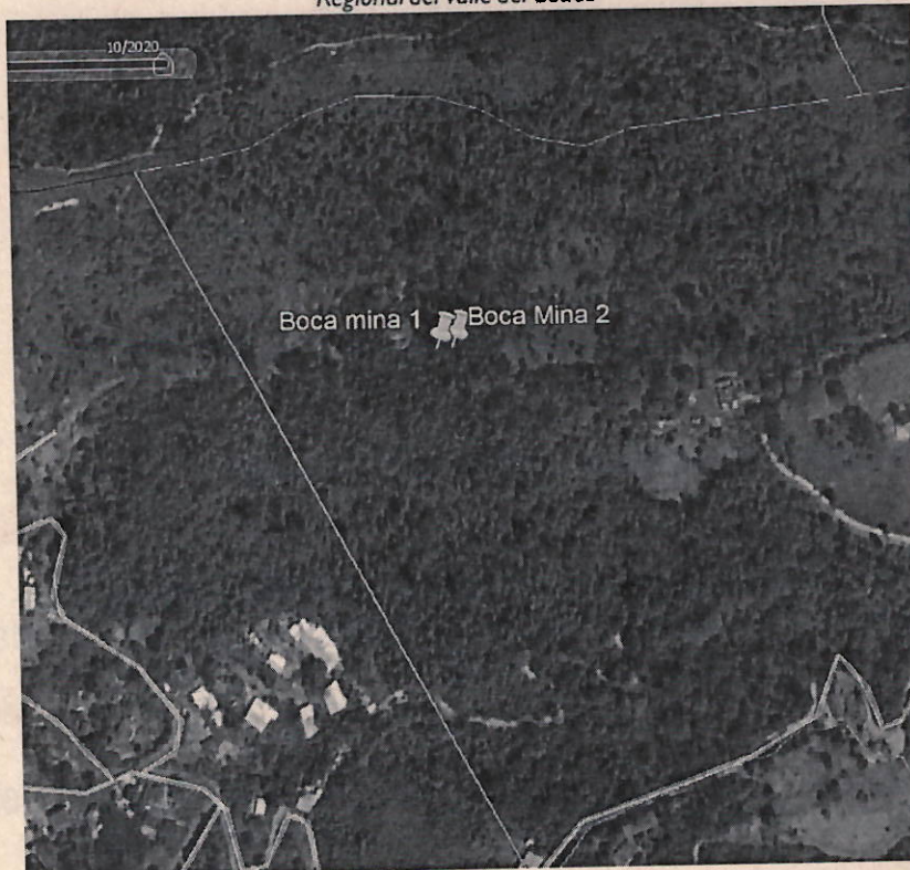
Imagen donde se muestra la ubicación de los puntos según coordenadas de los oficios, fuente Google Earth .

Corporación Autónoma Regional del Valle del Cauca