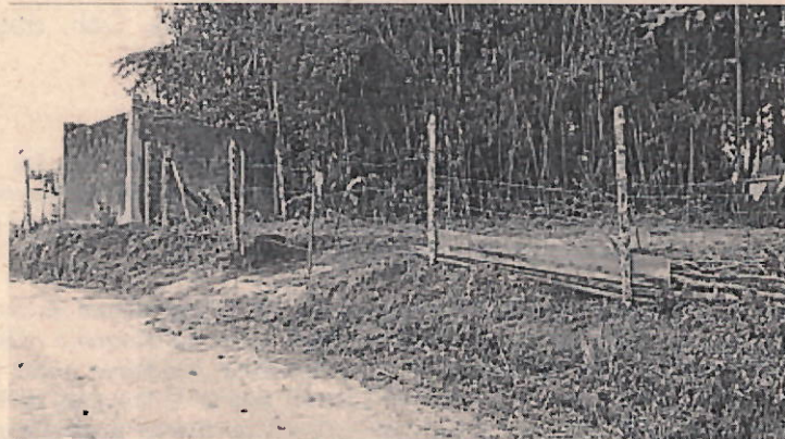
Fotos 3-4. Adecuación de entrada al predio con erradicación de vegetación existente