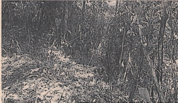
Fotos 1-2. Limpieza de vegetación o socola de bosque.