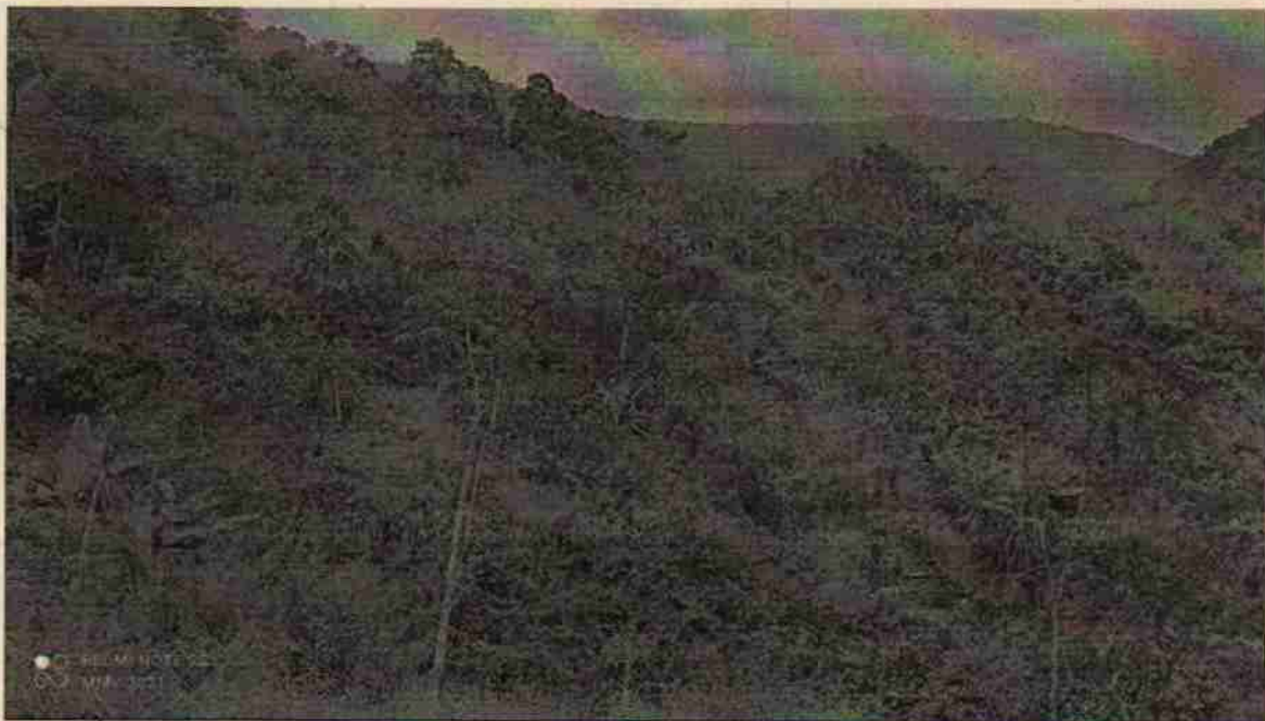
Foto 2. Áreas en cafetal abandonado, sitio de tala de árboles de la especie Guamo santafereño ( Inga edulis ).