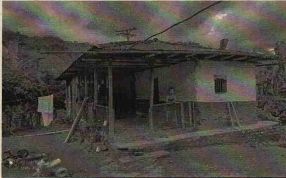
Foto 1. Vivienda del predio.