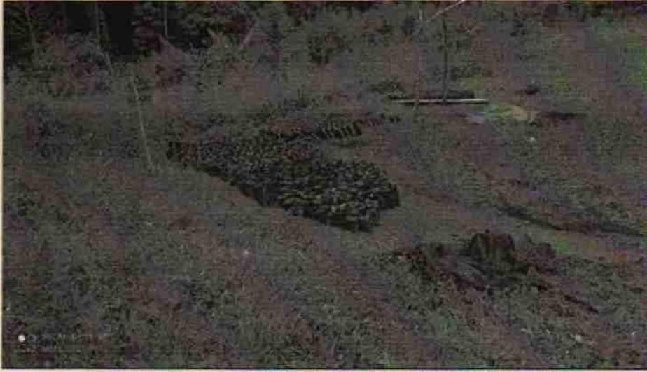
Foto 5. Sitio de almacenamiento de las chapolas de café.

Corporación Autónoma Regional del Valle del Cauca