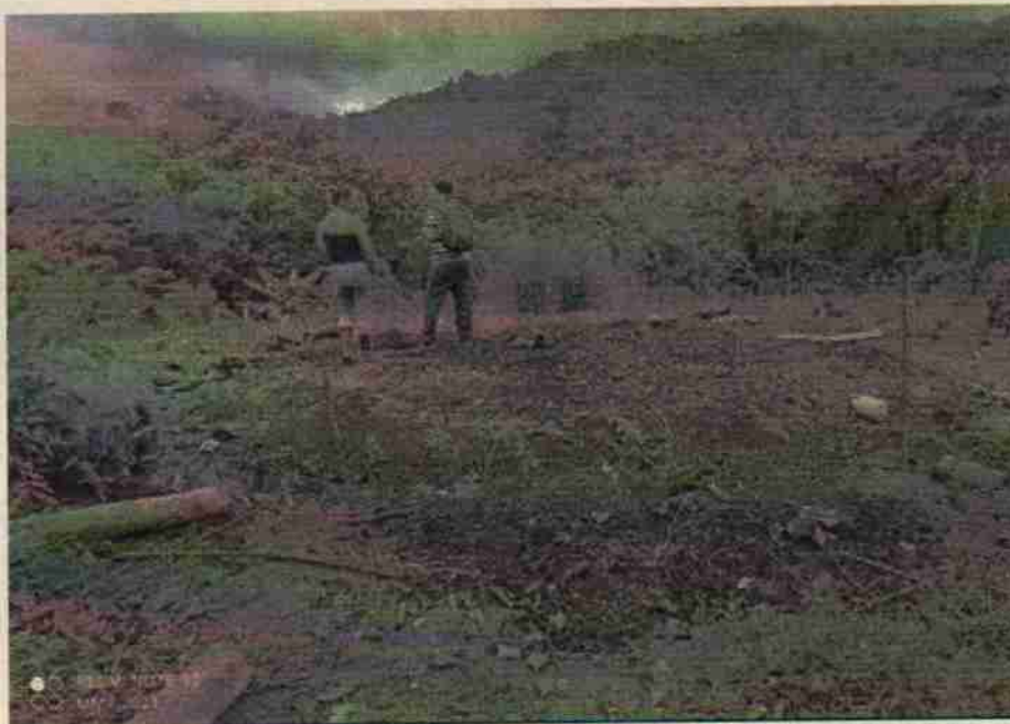
Foto 4. Sitio donde se llevó a cabo la quema de escombros vegetales.