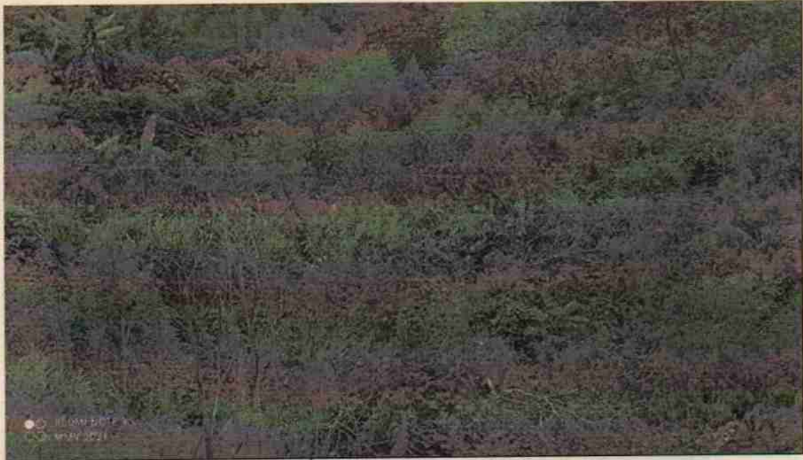
Foto 3. Área en cafetal abandonado.

Corporación Autónoma Regional del Valle del Cauca