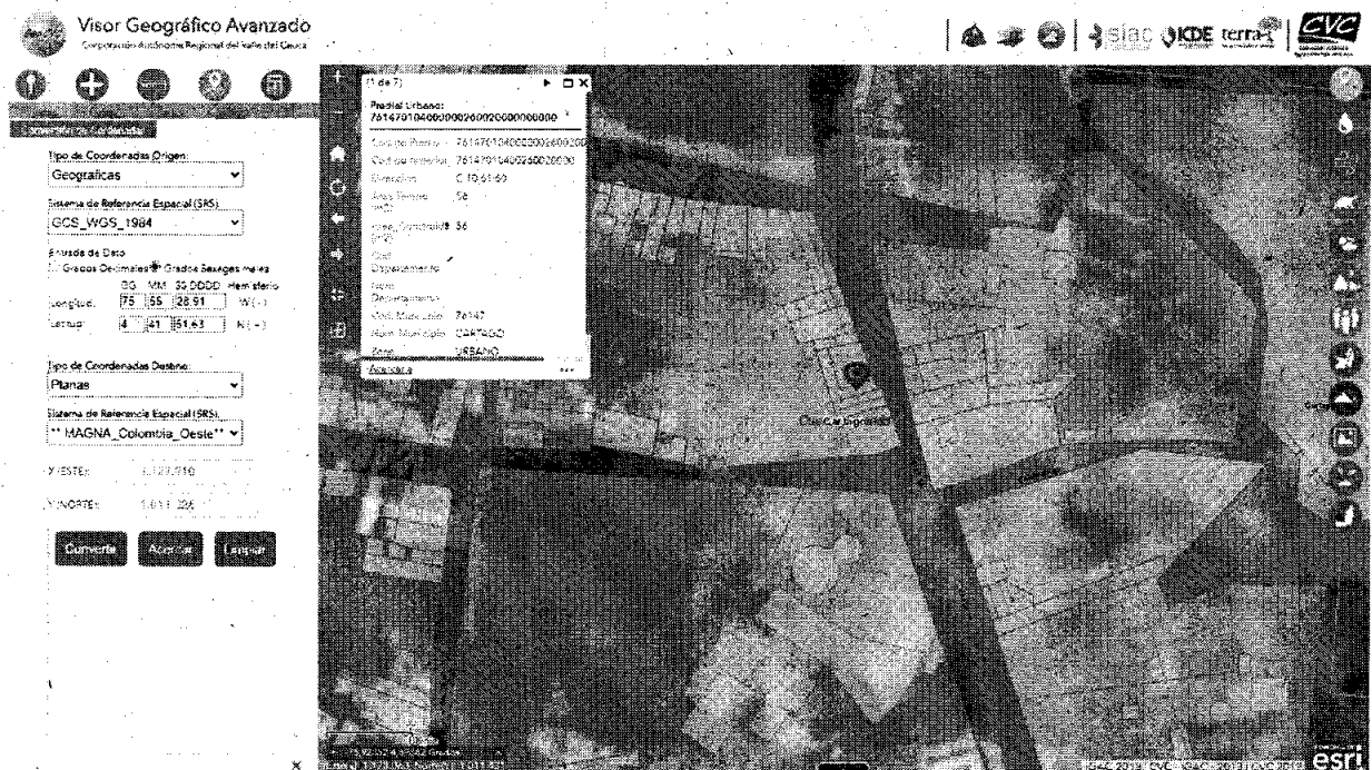
Ilustración 1. Ubicación geográfica. Geocvc2021