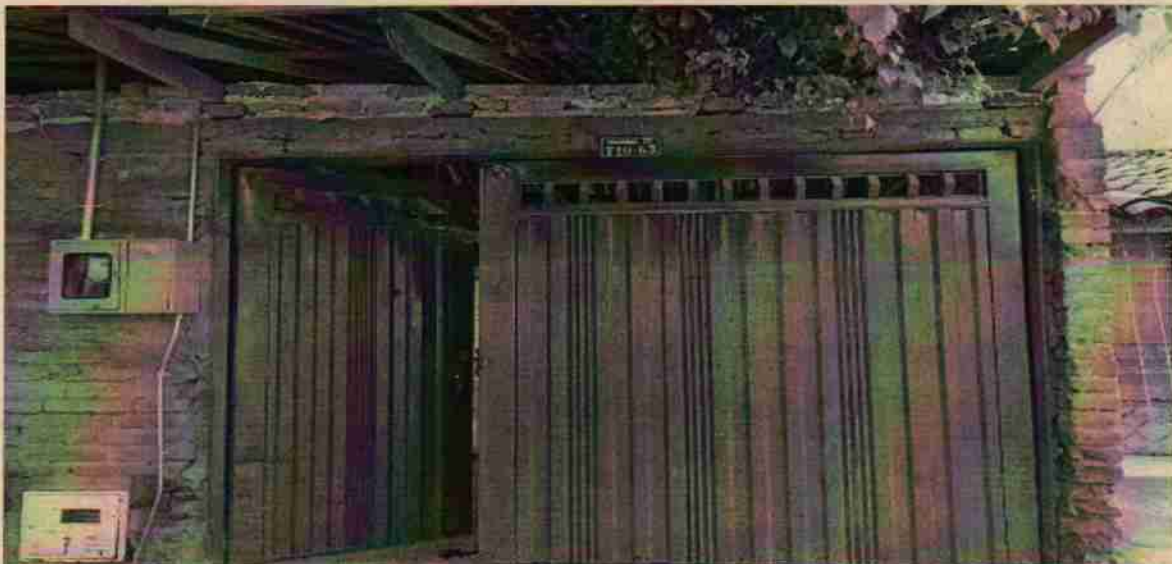
Foto No.1. Fachada de la vivienda objeto de la denuncia.

Se realizó la visita al predio indicado por el denunciante Diagonal 23 No. 10-63, Barrio El Porvenir, municipio de Tuluá, se observó que en el patio de la vivienda se está perforando un aljibe de aproximadamente 10 metros de profundidad, es de anotar que NO se está utilizando maquinaria para adelantar la labor, sólo se encontró en el lugar una motobomba eléctrica, la cual produce un ruido mínimo, además no estaba operando en el momento.