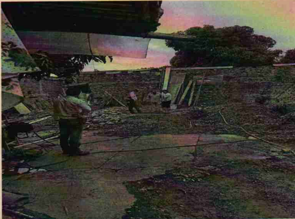
Foto No. 2. Pato de la vivienda donde se está perforando el pozo.

Corporación Autónoma Regional del Valle del Cauca