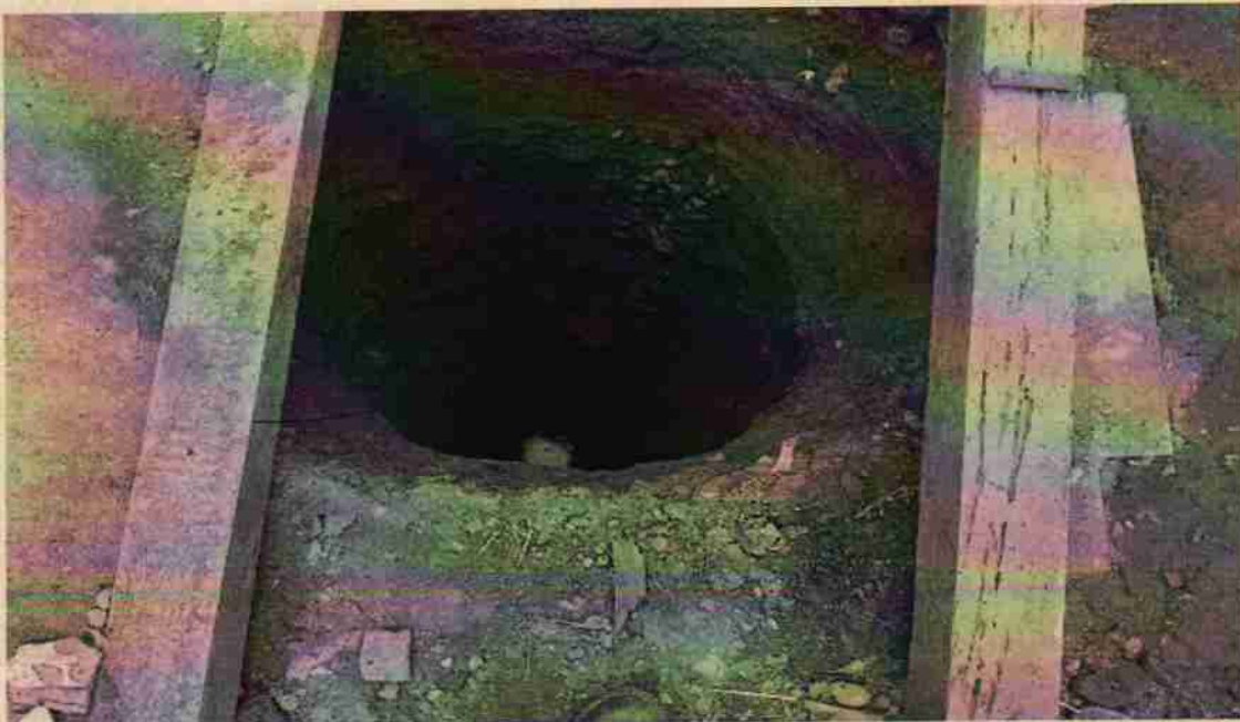
Foto No. 3. Perforación del aljibe de manera artesanal de aproximadamente 10 metros de profundidad.