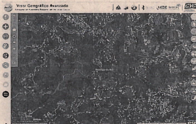
Mapa 1. Ubicación geográfica del lugar de la visita, callejón Anchicaya.

Jurisdicción especial del distrito de Cali, Corregimiento La Buitrera, Sector Alto de Anchicaya, Predio El Diviso, con coordenadas geográficas Latitud: 3.385455°N Longitud: 76.583774°O (Planas X= 1.054.867 Y= 866.130).