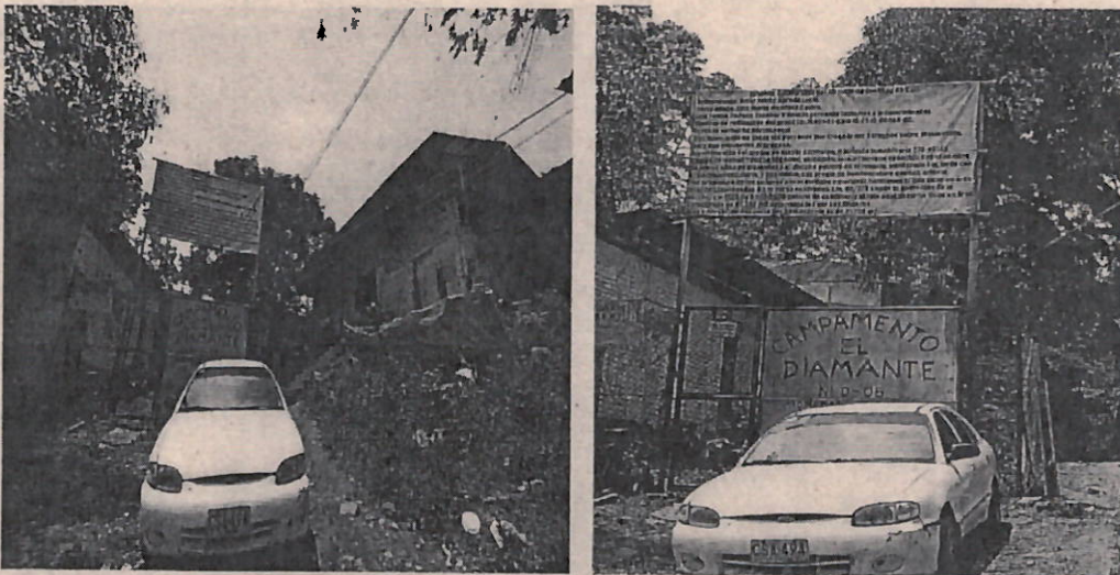
Imagen. Corregimiento La Buitrera, Sector Anchicaya, Predio El Diviso.