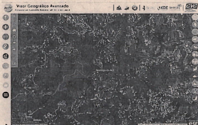
Mapa 1. Ubicación geográfica del lugar de la visita, callejón Anchicaya. Fuente: Visor GeoCVC.

Jurisdicción especial del distrito de Cali, Corregimiento La Buitrera, Sector Alto de Anchicaya, Predio El Diviso, con coordenadas geográficas Latitud: 3.385455°N Longitud: 76.583774°O (Planas X= 1.054.867 Y= 866.130).