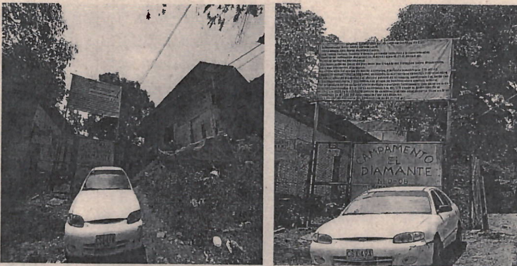
Imagen. Corregimiento La Buitrera, Sector Anchicaya, Predio El Diviso.