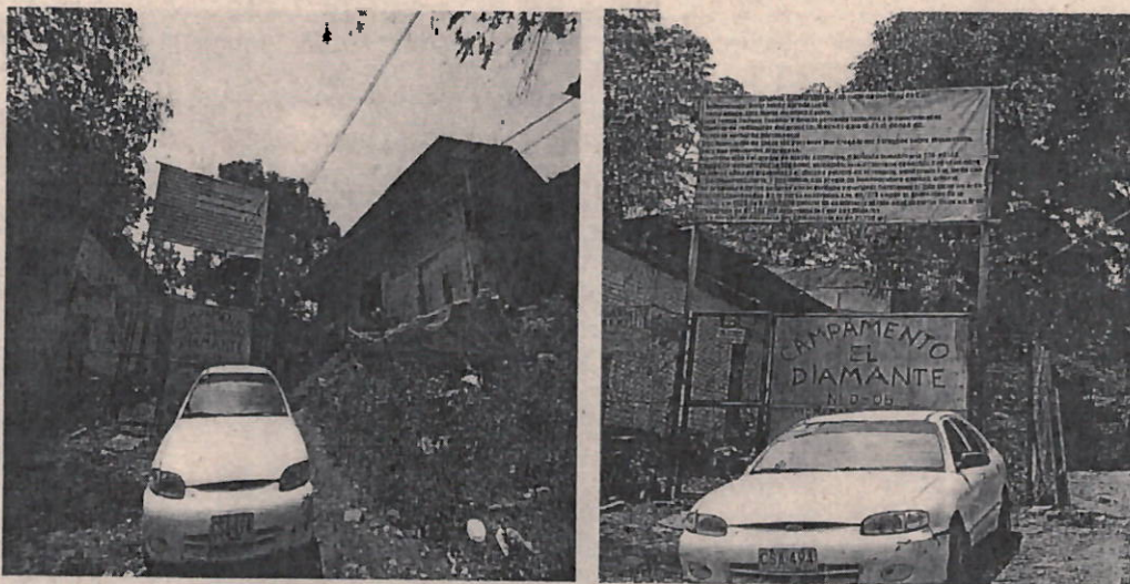
Imagen. Corregimiento La Buitrera, Sector Anchicaya, Predio El Diviso.