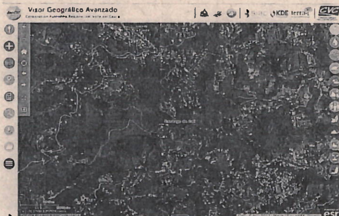
Mapa 1. Ubicación geográfica del lugar de la visita, callejón Anchicaya.

Jurisdicción especial del distrito de Cali, Corregimiento La Buitrera, Sector Alto de Anchicaya, Predio El Diviso, con coordenadas geográficas Latitud: 3.385455°N Longitud: 76.583774°O (Planas X= 1.054.867 Y= 866.130).