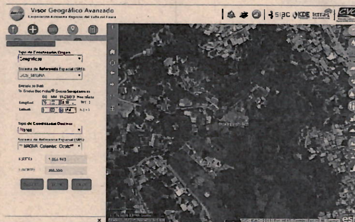
Mapa 1. Ubicación geográfica de la visita realizada.

Jurisdicción del Distrito de Cali, corregimiento de La Buitrera, km 4 vía La Buitrera Sector Via Polvorines, Inmediaciones de las coordenadas geográficas 3°22'52,154" N -76°33'54,18" y Planas X=1056948 E Y=865655 N