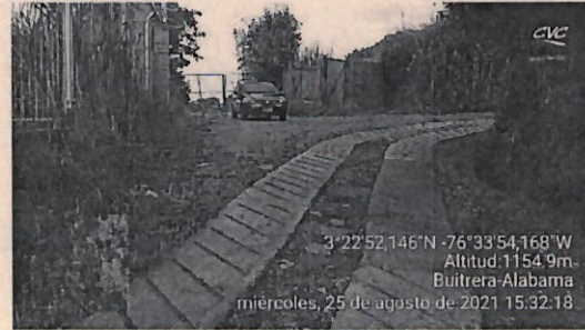
Foto 1. Zona recorrida para entrega de notificación.