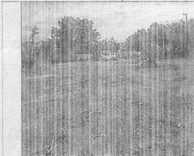
Figura 4. Evidencia de explanación de terreno en el Predio El crucero Casa y Lote .