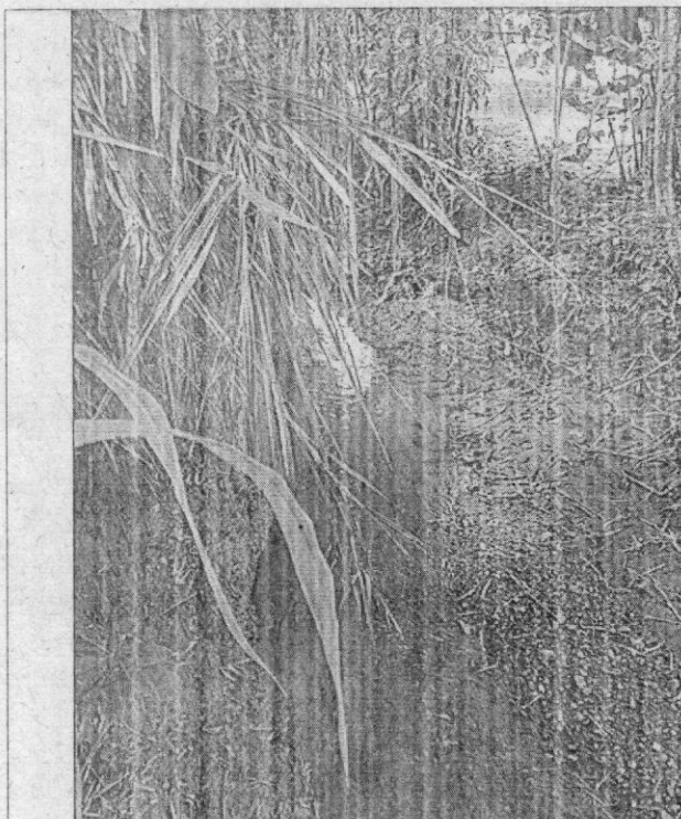
Figura 6. Quebrada La Italia.

“POR LA CUAL SE ACLARA Y CORRIGEN UNOS ERRORES FORMALES EN LA RESOLUCIÓN 0760 No. 0761 – 000474 DE 2021, Y SE TOMAN OTRAS DETERMINACIONES”