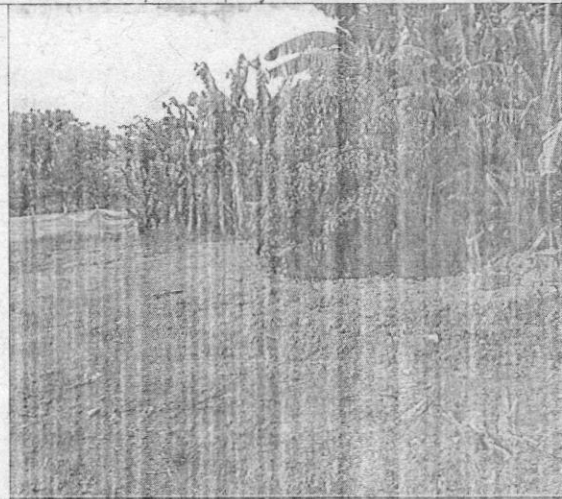
Figura 5. Zona Forestal Protectora de la Quebrada La Italia.