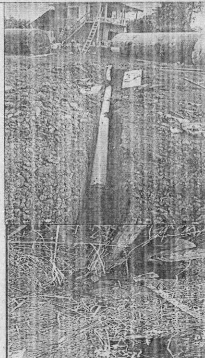
Figura 7. Tubería de descarga de las aguas residuales de la vivienda a la quebrada La Italia.

Que con base en lo evidenciado en el informe de visita de fecha 24 de junio de 2021, y en atención a lo establecido en el artículo 13 de la Ley 1333 de 2009, el día 6 de julio de 2021, se expidió la Resolución 0760 No. 0761 – 000474 de 2021, “POR LA CUAL SE IMPONE UNA MEDIDA PREVENTIVA DE SUSPENSIÓN DE ACTIVIDADES Y SE TOMAN OTRAS DETERMINACIONES”, acto administrativo a través del cual también se le INICIO el procedimiento sancionatorio ambiental a los presuntos infractores.