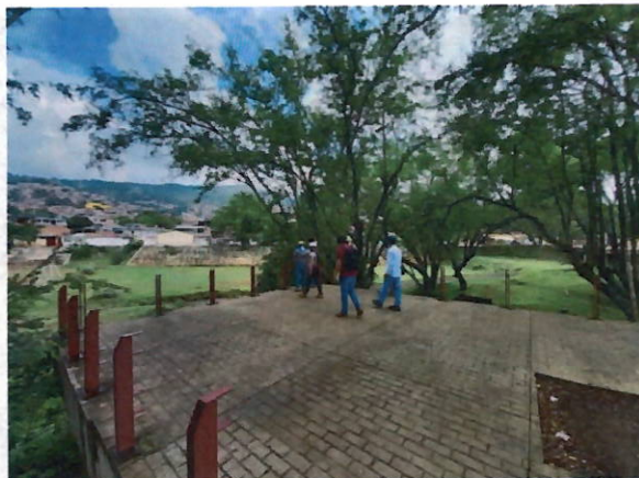
Imágenes tomadas el 4 de noviembre de 2021 por la Interventoría.

Que en visita de campo al día siguiente a la terminación del contrato de obra, el 8 de noviembre de 2021 , la supervisión confirmó que la obra no había sido terminada. En la imagen a continuación se evidencia el estado de la construcción del puente peatonal, en el cual se evidencia que apenas se habían colocado las dos vigas principales y tres vigas secundarias, pero hacia falta la instalación de las demás vigas, la construcción de la losa, la construcción del arco, la instalación de tensores, barandas y demás actividades.