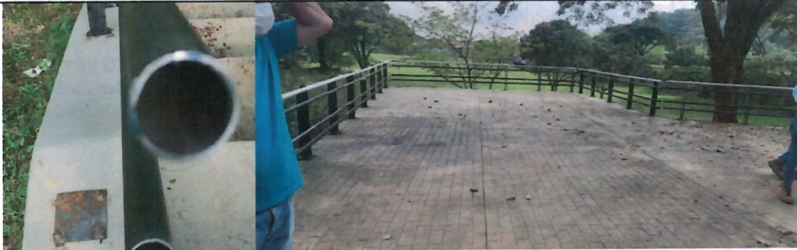
Imágenes tomadas el 23 de diciembre de 2021 por la supervisión a la interventoría CVC

El anterior registro fotográfico, junto con el acta levantada el día 23 de diciembre de 2021, demuestra de manera fehaciente que el Consorcio Cañaveralejo 2018, 46 días después de finalizado el plazo contractual, no había cumplido con las obligaciones del contrato de obra 702-2018.