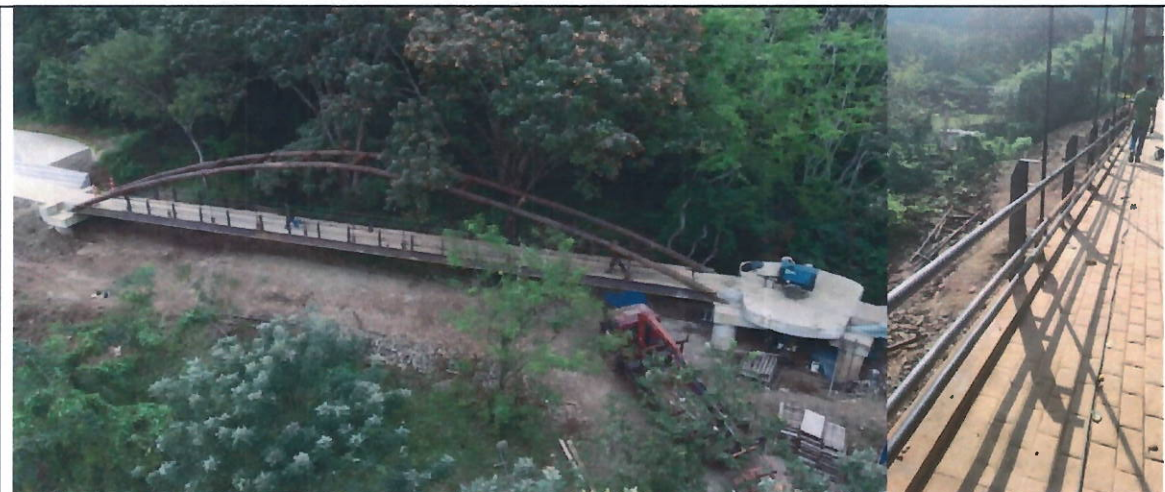
Imágenes tomadas el 23 de diciembre de 2021

MEDIANTE LA CUAL SE RESUELVE RECURSO DE REPOSICIÓN CONTRA LA RESOLUCIÓN 0100 No. 0600-747-2021 "POR LA CUAL SE DECLARA EL INCUMPLIMIENTO DEL CONTRATO DE OBRA PÚBLICA CVC N° 0702 DE 2018"