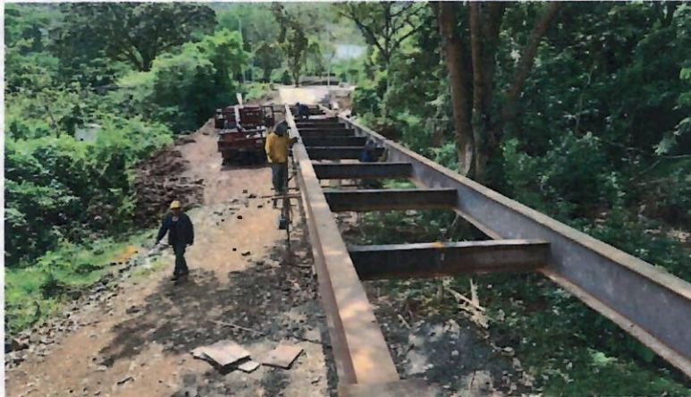
Imágenes tomadas el 17 de noviembre de 2021 por la supervisión a la interventoría CVC

Finalmente, el 23 de diciembre de 2021 (46 días después de la fecha de finalización del contrato de obra), en respuesta al recurso de reposición presentado por el Consorcio Cañaveralejo 2018 y la Aseguradora Seguros del Estado S.A., donde aludían que el incumplimiento representaba un hecho superado porque se habían terminado al 100% las actividades pendientes, se realiza visita al sitio de obra y se toman las siguientes fotografías (imágenes tomadas del acta de reunión) donde se aprecia el estado de algunos frentes de trabajo sin terminar.