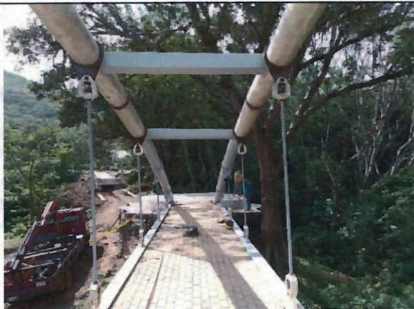
Imágenes tomadas el 4 de noviembre de 2021 por la Interventoría.