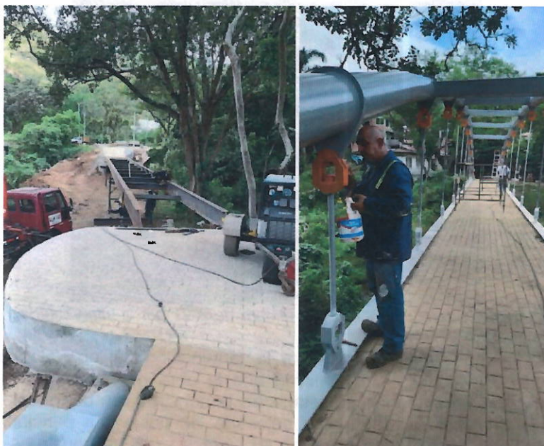
Imágenes tomadas el 10 de noviembre de 2021 por la supervisión a la interventoría CVC