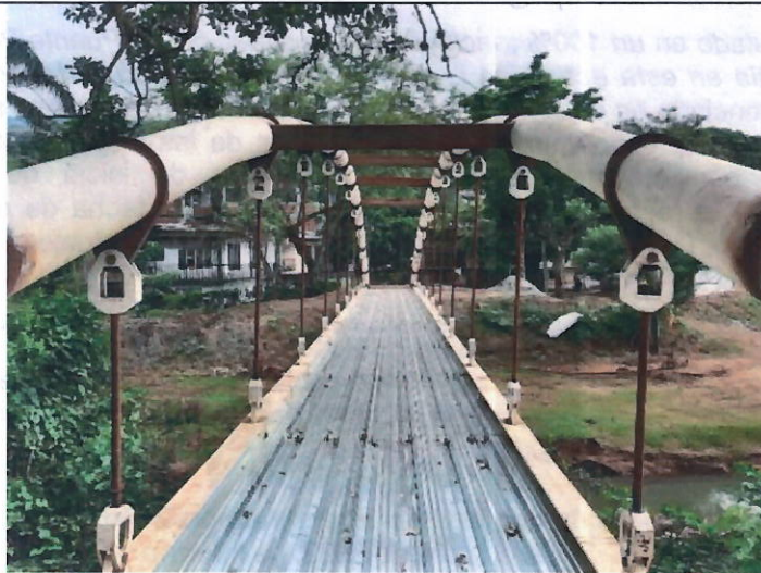
Imágenes tomadas del informe de interventoría de octubre de 2021.

El 4 de noviembre de 2021 , a tres días de la terminación del contrato de obra, en el marco de la practica de pruebas del proceso de incumplimiento, la interventoría genera el informe "INFORME DE AVANCE DE OBRA AL 4 DE NOVIEMBRE DE 2021 EN CUMPLIMIENTO DE LO ORDENADO EN LA AUDIENCIA DE PRESUNTO INCUMPLIMIENTO DEL DIA 3 DE NOVIEMBRE DE 2021" en el cual se consigna que: