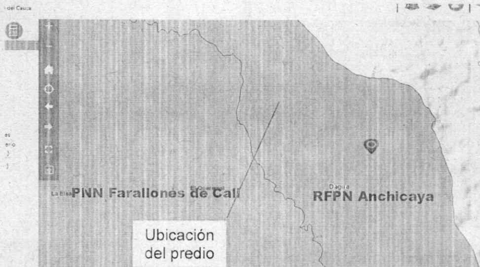
Imagen No.1 Ubicación del predio dentro de la RFPN Anchicayá

POR MEDIO DEL CUAL SE FORMULA UN PLIEGO DE CARGOS Y SE TOMAN OTRAS DETERMINACIONES.