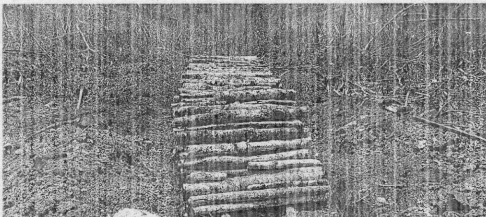
Imagen No. 4 Madera apilada para la quema de carbón vegetal

(Hasta aquí lo extraído del Informe de Visita)