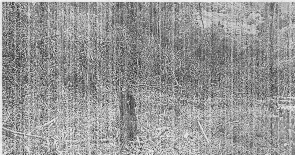
Imagen No. 2 Evidencia de Tala realizada en el predio