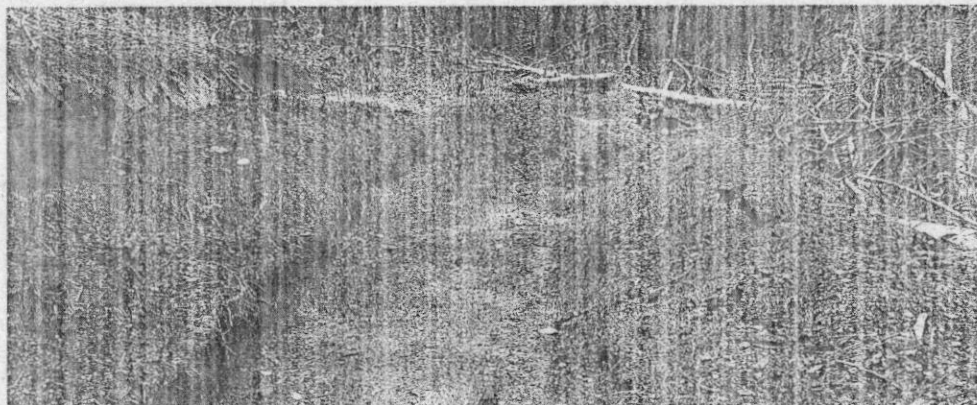
Imagen No. 3 Quema de carbón vegetal

POR MEDIO DEL CUAL SE FORMULA UN PLIEGO DE CARGOS Y SE TOMAN OTRAS DETERMINACIONES.