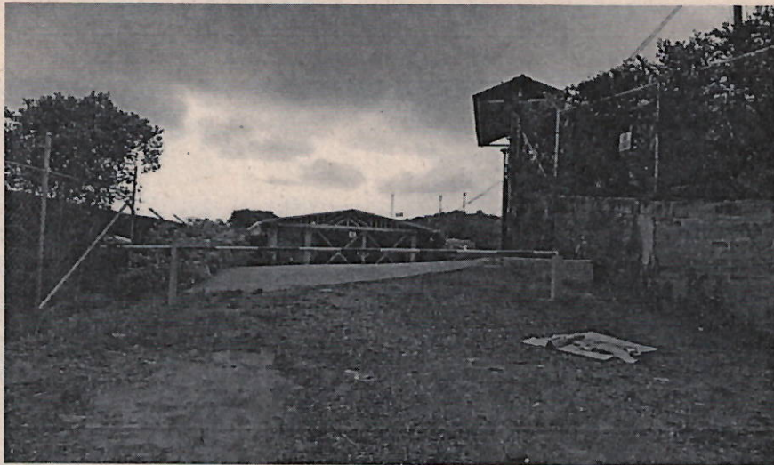
Imágenes. Corregimiento La Buitrera, Callejón Las Terrazas, Predio Yarumal. Coordenadas geográficas Latitud: 3.386650°N Longitud: 76.579830°O.