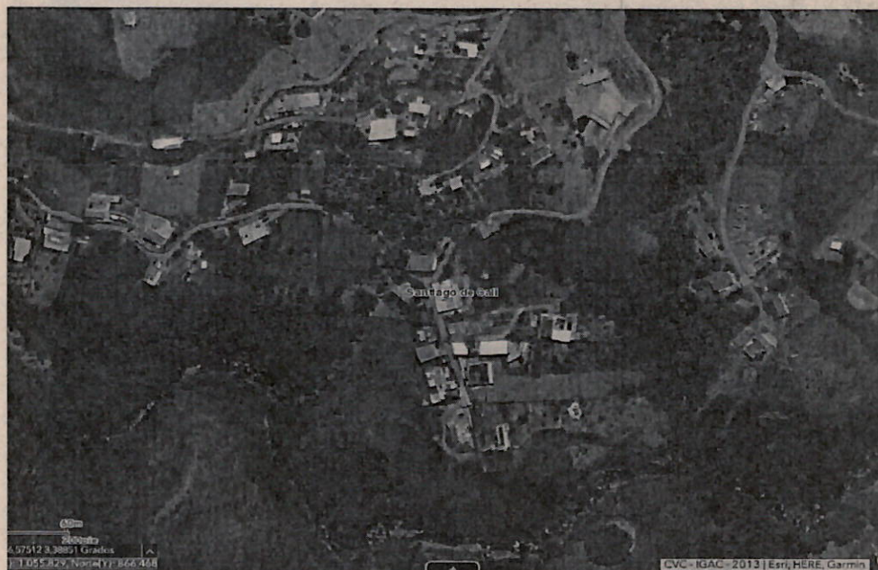
Mapa 1. Ubicación del lugar de la visita, Corregimiento La Buitrera, Callejón Las Terrazas.

Jurisdicción especial del distrito de Cali, Corregimiento La Buitrera, Callejón Las Terrazas, Predio Yarumal, con coordenadas geográficas Latitud: 3.386650°N Longitud: 76.579830°O.