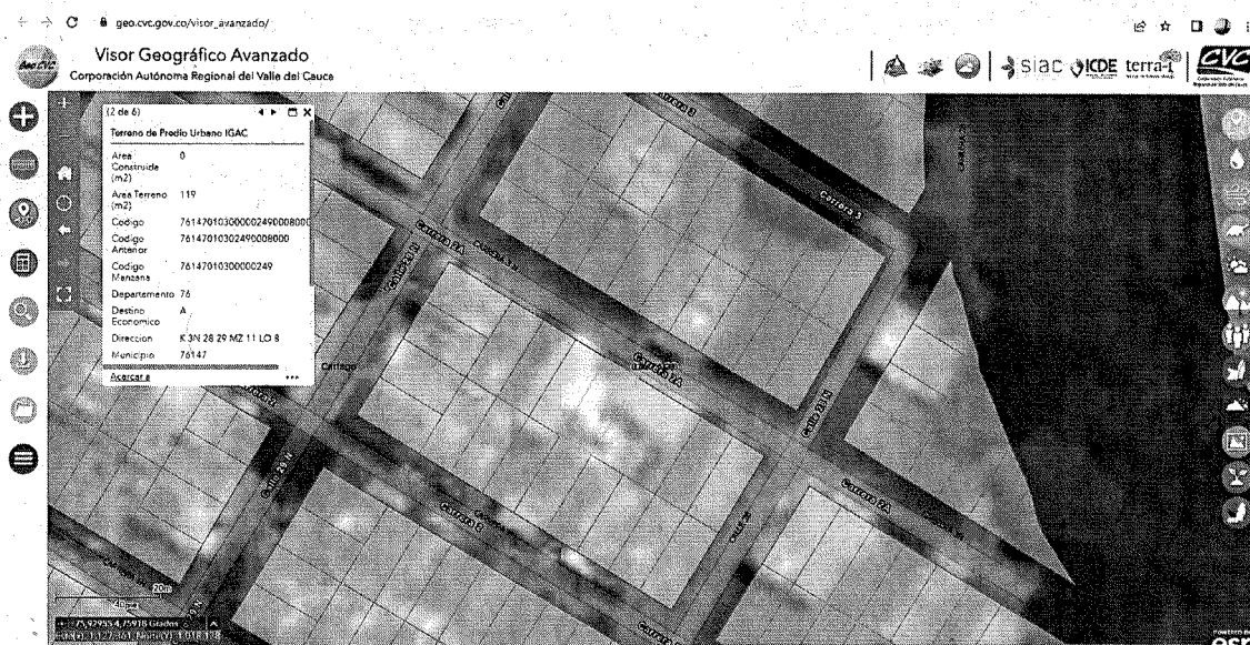
Localización GEOCVC 2022

Coordenadas geográficas: 4°45'31.9"N - 75°55'45.10"W