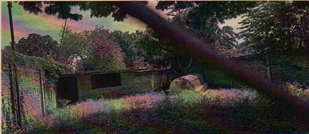
Foto No. 2. Interior del lote el cual tiene buen cerramiento y hay un tanque abandonado.

Corporación Autónoma Regional del Valle del Cauca