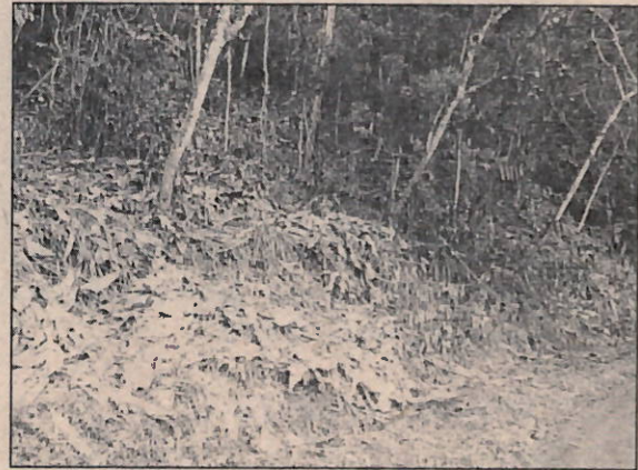
Imágenes 2 y 3. Adecuación de terrenos contigua a vía que conduce a la Palmera.