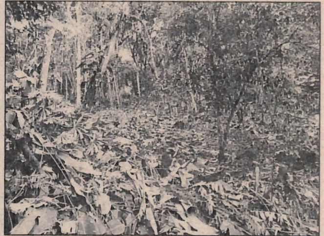
Imágenes 8 y 9. Adecuación de terrenos contigua a vía que conduce a la Palmera.

Con la información recopilada en campo se procede a realizar plano general del área intervenida, el cual se muestra en la imagen 10.