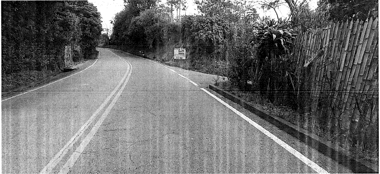
Fotografía 1. Panorámica entrada Vereda La Unión.

Corporación Autónoma Regional del Valle del Cauca