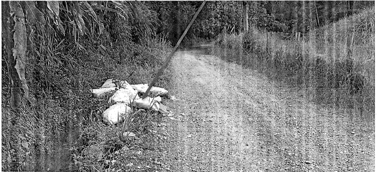
Fotografía 2. Panorámica Via - Basura.