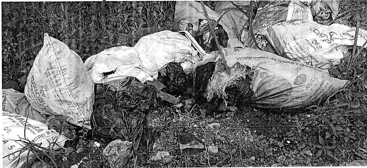
Fotografía 4. Residuos de Plumas y Viseras de Pollos.