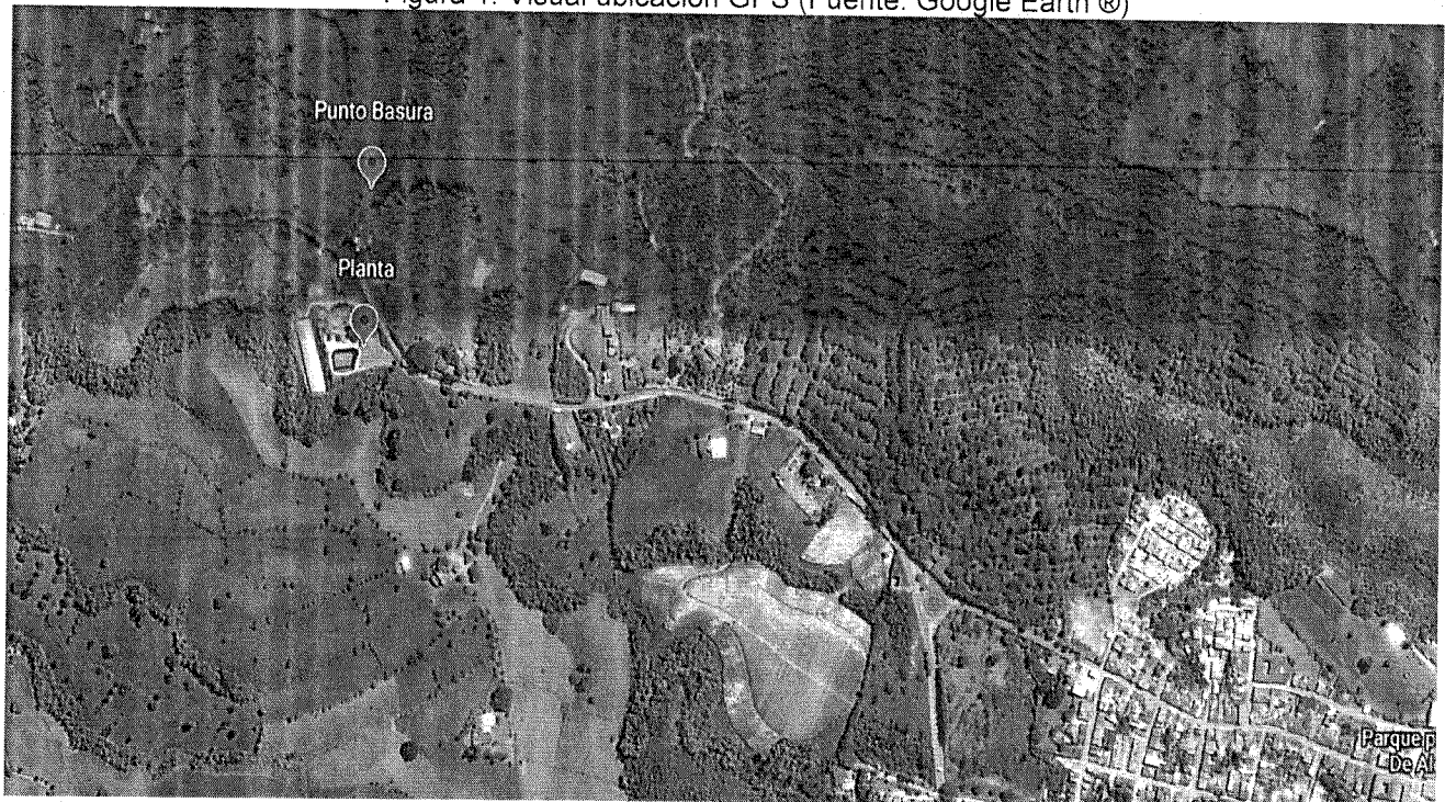
Figura 1: Visual ubicación GPS

Coordenadas geográficas Samán: N: 4°40'50.64" O: 75°54'41.38" Altura: 1214 m.s.n.m.