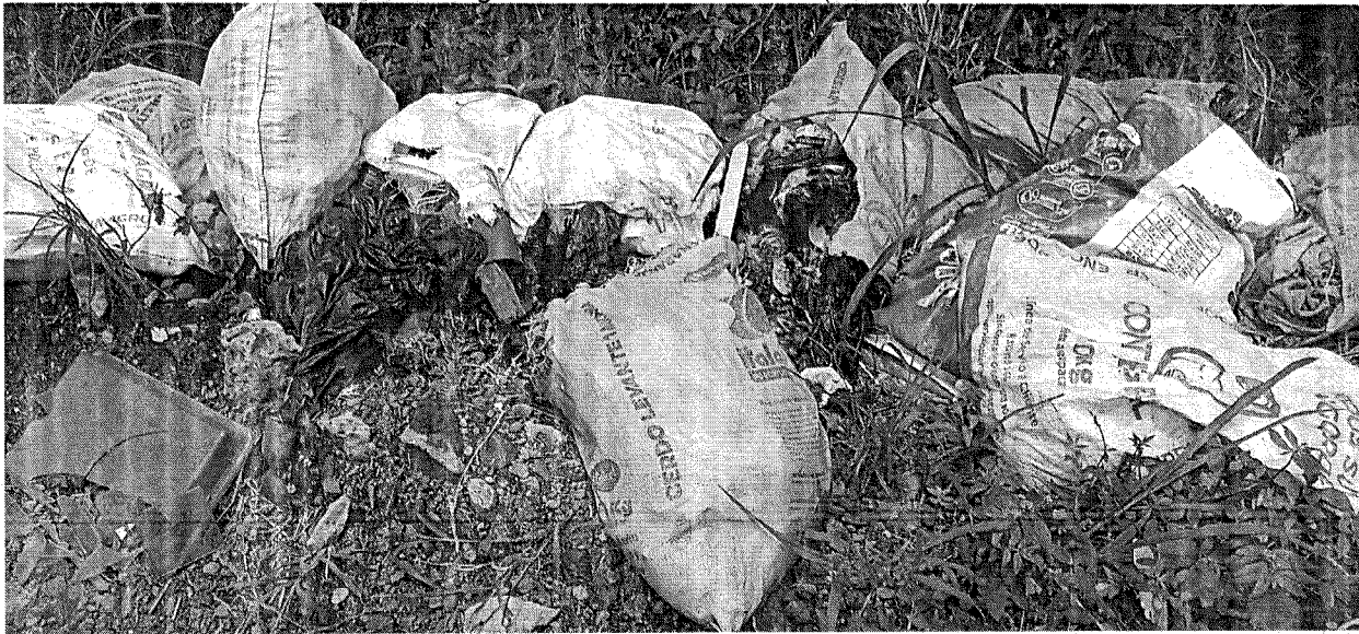
Fotografía 3. Residuos solidos (Basura).

Corporación Autónoma Regional del Valle del Cauca