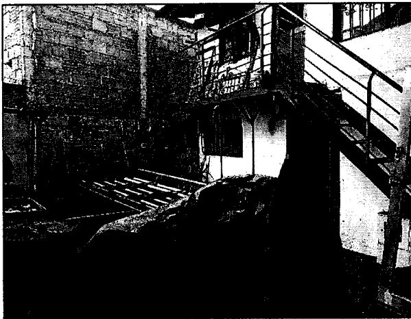
Figura 1. Instalaciones de la metalistería