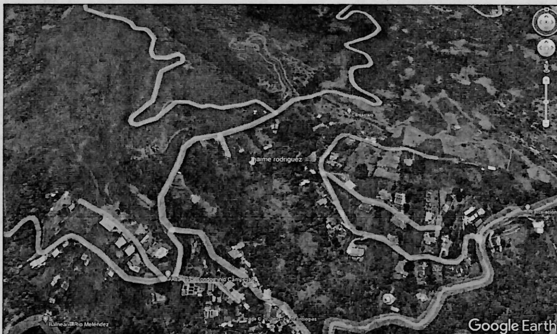
Mapa 1. Ubicación geográfica del lugar de la visita, Sector La Campana, Vereda Alto de los Mangos.

Jurisdicción especial del distrito de Cali, Corregimiento La Buitrera, Sector La Campana, Vereda Alto de los Mangos, Predio La Esperanza, con coordenadas geográficas Latitud: 3.394500°N Longitud: 76.587222°O.