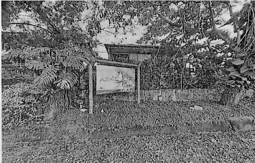
Imagen. Ubicación del lugar de la visita, diagonal al Mariposario. (Planas X=1.056.475 Y= 866.420).

investigación y traslado para presentar alegatos de conclusión”, se indago en el sector con personas de la zona, pero no se obtuvo información alguna.