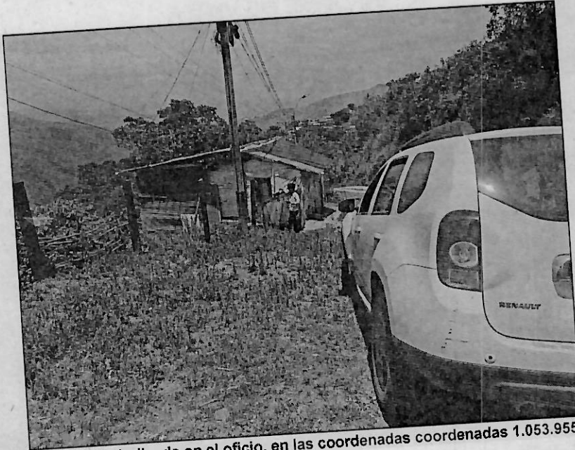
Imagen 1. Visita al predio indicado en el oficio, en las coordenadas coordenadas 1.053.955 W, 875.110 N.

Corporación Autónoma Regional del Valle del Cauca