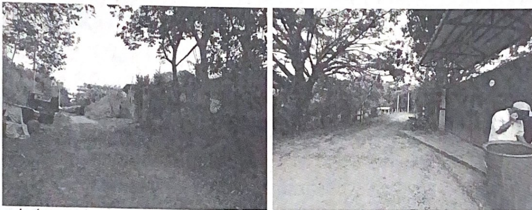
Imágenes. Lugar de la visita, Sector La Campana, Vereda Alto Los Mangos, límites con la Vereda de La Fonda.