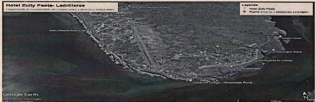
Imagen 1. Geolocalización Hotel Zully Paola - Ladrilleros 3°56'23.6"N; 77°21'56.5"O

77°21'56.5"O y coordenadas planas (MAGNA – Colombia-Oeste) Latitud Norte 927.430 Longitud este 967.994.