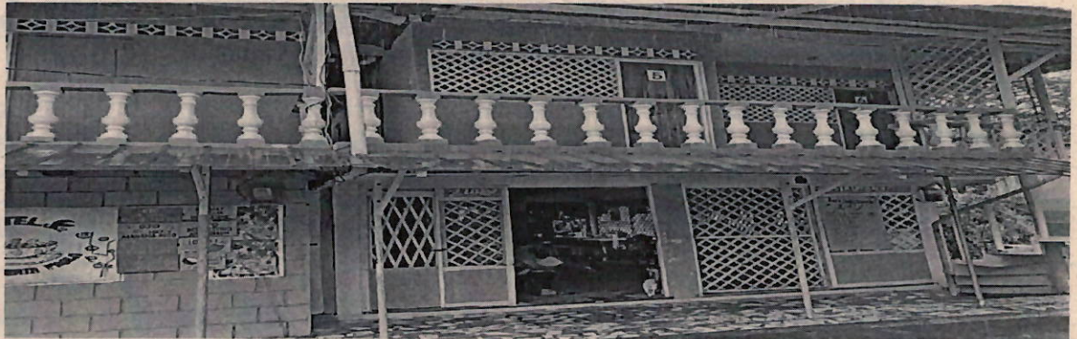
Foto 2. Hotel Zully Paola, Corregimiento de Ladrilleros – Bahía Málaga, Vista Frontal del Bloque # 2.