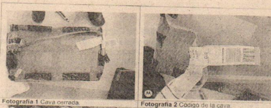
Fotografía 1 Cava cerrada

Se adjunta registro fotográfico de la totalidad del procedimiento.