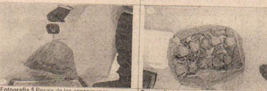
Fotografía 5 Pesaje de los especímenes.