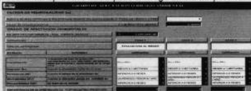
Imagen 2: Pantallazo del aplicativo Excel para el riesgo ambiental para tasación de multa.

El valor obtenido representa el nivel potencial de riesgo generado por la infracción de la norma en este sentido, y teniendo en cuenta que la infracción no se concretó en afectación ambiental, se le asigna un valor el cual debe ser monetizado para ser integrado en el modelo matemático. Obtenido el valor de riesgo, se determinó el valor monetario del mismo. En tal sentido el aplicativo en Excel Corporativo para la tasación de la multa arrojó el siguiente resultado: