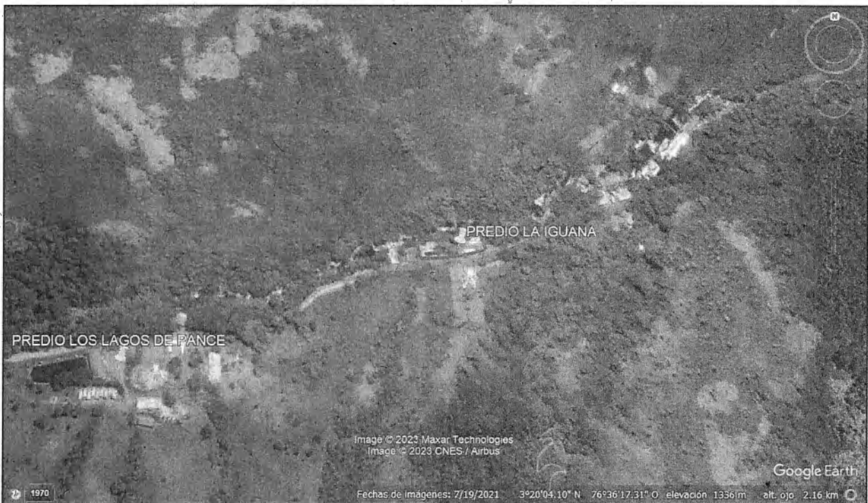
Imagen ubicación Predio La Iguana

Predio La Iguana - vereda San Francisco - corregimiento de Pance – coordenadas geográficas 3°20'4.29" Norte - 76°36'16.51" Oeste.