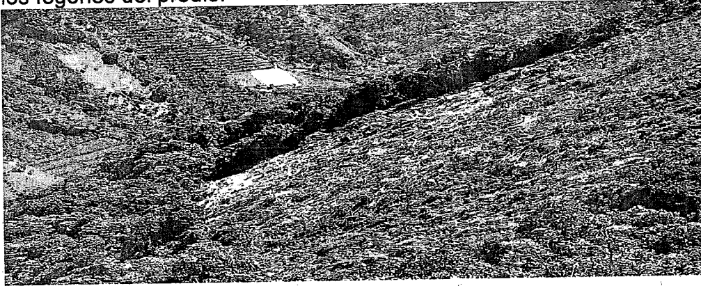
Fotografía 1. Área intervenida