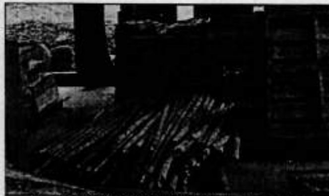
Figura 1. Productos forestales objeto de decomiso preventivo.

Se realiza la inspección en la bodega 3, asignada a la UGC Yotoco, Mediscano, Riofrio y Piedras, del CAV de Flora de la CVC DAR Centro Sur, con la finalidad de verificar la existencia del material forestal decomisado el día 8 de abril de 2021, correspondiente 90 puntales de 2.5m de longitud equivalentes a 0.4m 2 de Guadua ( Guadua angustifolia ), encontrándose en mal estado fitosanitario.