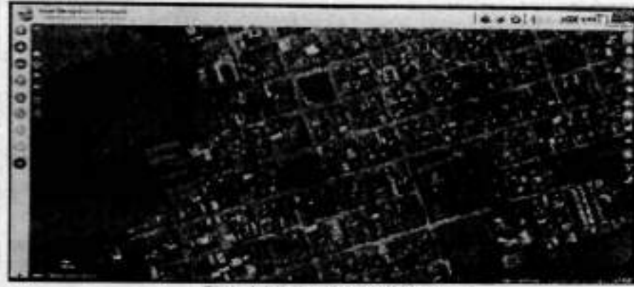
Figura 1. Localización procedimiento

7. LOCALIZACIÓN: Carrera 3 con calle 6, Barrio Centro - Ginebra, Valle del Cauca. Coordenadas: Longitud: -76.26802 Latitud: 3.72442 Cuenca hidrográfica: Zabaletes