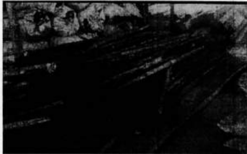
Figura 2. Productos dispuestos en CAV de flora de CVC.

un volumen de 0.4 m 3 aproximadamente, sin Salvoconducto Único Nacional en Línea (SUNL), productos los cuales fueron transportados hasta el CAV de flora de la CVC DAR Centro Sur.